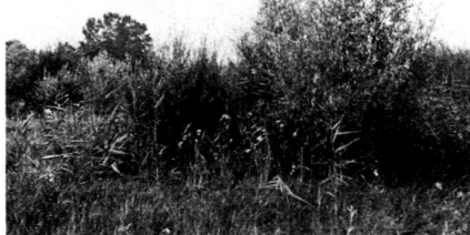
Beispiel 2: Wechselweise Feucht- und Trockenstandorte (Gemeinde Meisberg)

Description: Dans le cadre de l'aménagement régional de Granges, Büren et de l'Oberer Bucheggberg, les superficies et éléments présentant un intérêt biologique ou esthétique furent recensés comme données de base pour une amélioration globale ultérieure. A l'aide d'une interprétation stéréoscopique de prises de vue aériennes suivie de la reconnaissance sur le terrain, 27 zones du paysage apparemment importantes furent relevées en collaboration avec l'inspectorat cantonal de la protection de la nature, puis soumises à une deuxième inspection en présence de l'ingénieur en charge de la protection du patrimoine et d'un représentant de la co-opérative cadastrale. Un rapport fut dressé contenant la description des zones, leur importance écologique, ainsi que les objectifs visés et les suggestions pour y parvenir. Y figuraient par exemple des ruisseaux, des bandes de forêt, des boqueteaux pare-vent, des bosquets et des biotopes humides alternant avec des biotopes secs.