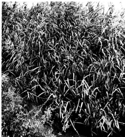
Beispiel 1: Bachlauf Leugene (Bereich Eisenbahnbrücke bis Aare; Gemeinde Lengnau)

Beschreibung: Im Raume der Regionalplanung Grenchen, Büren, Oberer Bucheggberg wurden biologisch oder landschaftsästhetisch bedeutsame Flächen und Elemente als Grundlage für spätere Behandlungsmöglichkeiten im Rahmen der Gesamtmelioration ausgeschieden. Aufgrund einer stereoskopischen Luftbildinterpretation mit anschliessender Feldbegehung wurden in Zusammenarbeit mit dem kantonalen Naturschutzinspektorat 27 bedeutsam erscheinende Landschaftsbestandteile erfasst und in einer zweiten Begehung mit dem beauftragten Kulturingenieur und einem Vertreter der Flurgemeinschaft überprüft. In einem Bericht wurden die Landschaftsbestandteile beschrieben, ihre ökologische Bedeutung erfasst sowie Zielvorstellungen und Vorschläge für deren Behandlung ausgearbeitet. Es waren dies z. B. Bachläufe, Gehölzstreifen, Windschutzgehölze, Feldgehölze und auch wechselweise Feucht- und Trockenstandorte.