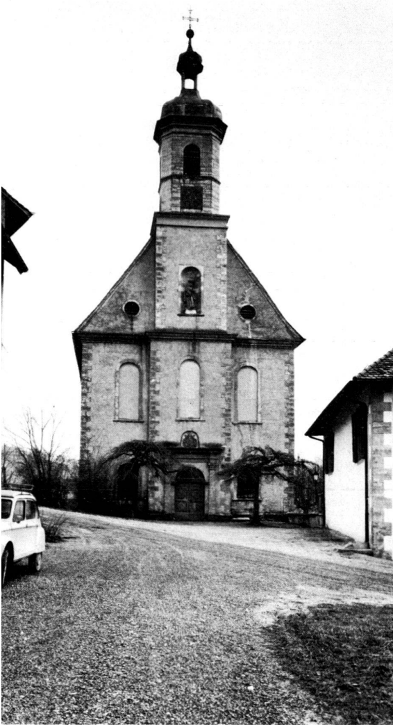
Links: Westfassade der Stiftskirche Olsberg. Heutige Situation.

In the course of the restoration work on the collegiate church, an attempt is being made to improve the unsatisfactory situation in front of the church entrance also. As the road is indispensable, it is planned to erect a wall to retain the slope which extends up to the church door, so making it possible to lay out an even forecourt. To a large extent, the wall follows the ground plan of the demolished part of the Gothic church and re-establishes the original visual link between the church and the convent building. The result is a church forecourt which is separated from the traffic and whose self-contained character can be reinforced by two tall lime trees. To the west of the church, the road lies along the same axis as the church. Although this axial relationship is not absolutely necessary for a Gothic church, the late-baroque façade, which is the decisive element, can only be enhanced by the planned measure.