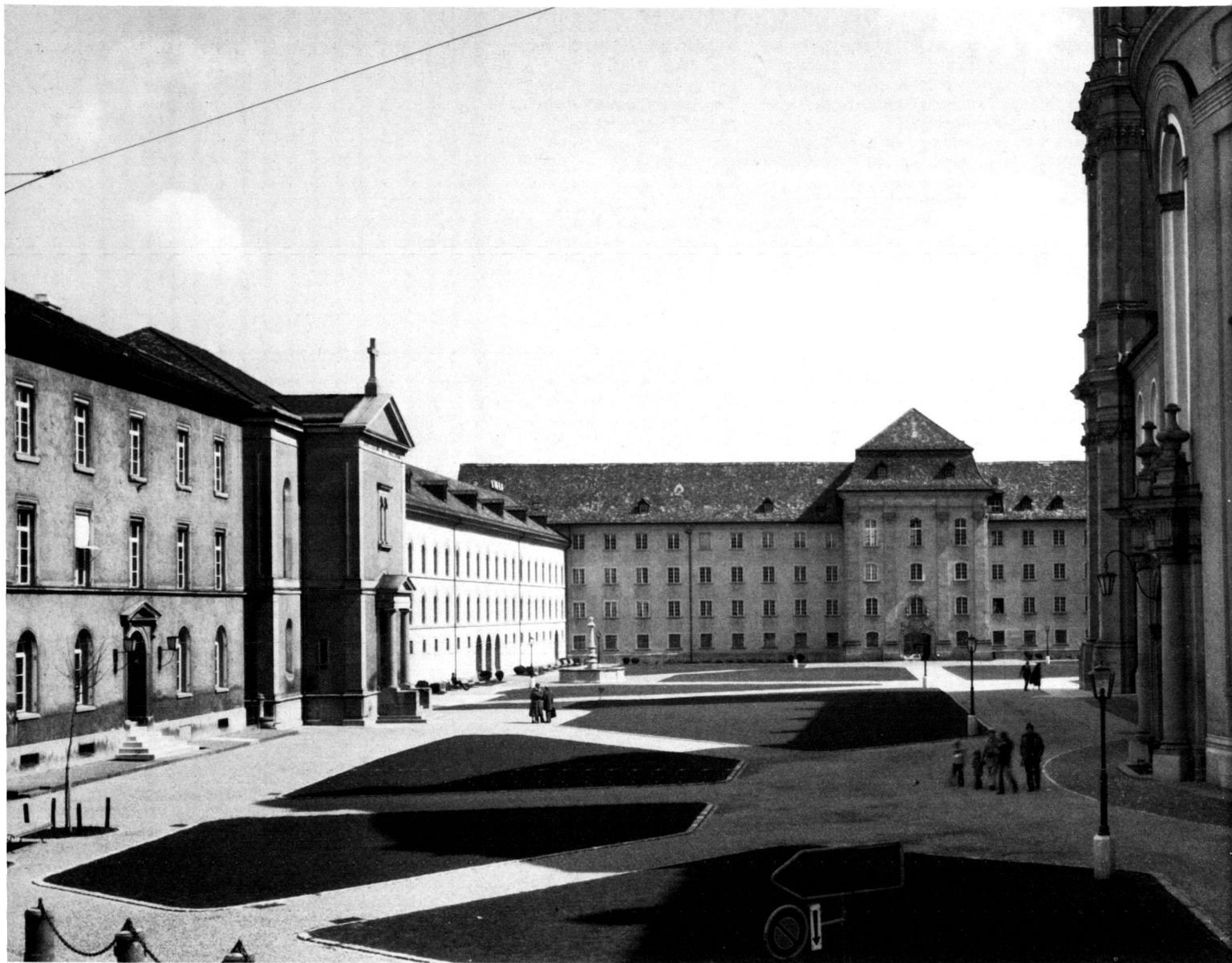
Der Klosterhof von St. Gallen heute. Links: Schule, Kinderkapelle und Zeughausflügel (Felix Wilhelm Kubly 1838–1841). Im Hintergrund: Neue Pfalz (Ferdinand Beer 1767–1769). Rechts: Kathedrale (Peter Thumb 1755–1760 und Michael Beer 1761–1767). Die Begrünung beschränkt sich auf streng formale Rasenflächen, die das Architektur-Ensemble ungeschmälert zur Wirkung kommen lassen.