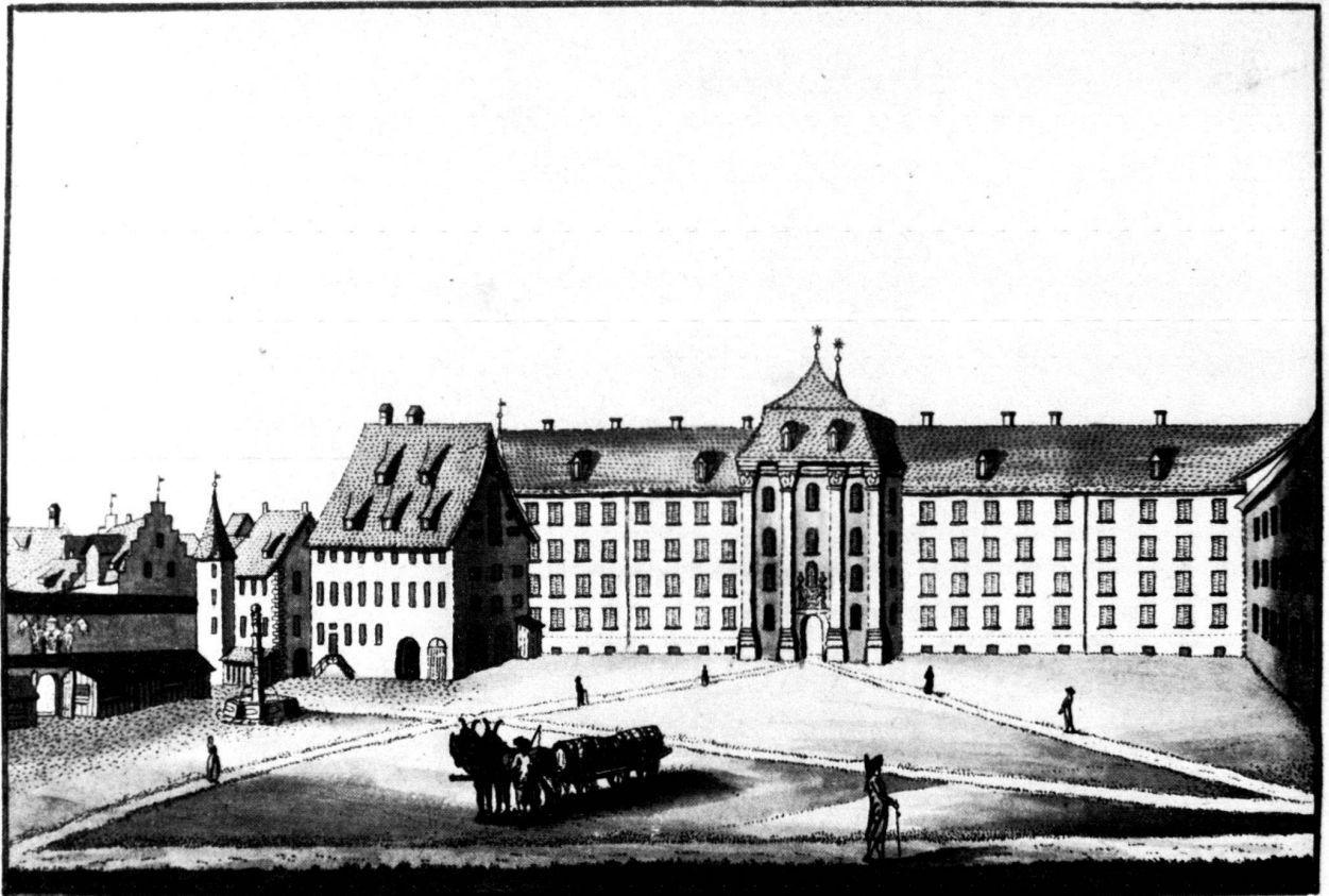
Das hochfürstliche Stift gegen der Pfalz in St. Gallen.

View of the New Palace prior to the construction of the Armoury Wing, from an engraving by J. C. Mayr, about 1790. The illustration shows an unadorned square with paths laid out purely for the greatest convenience; clearly for the most part the model for the present arrangement.