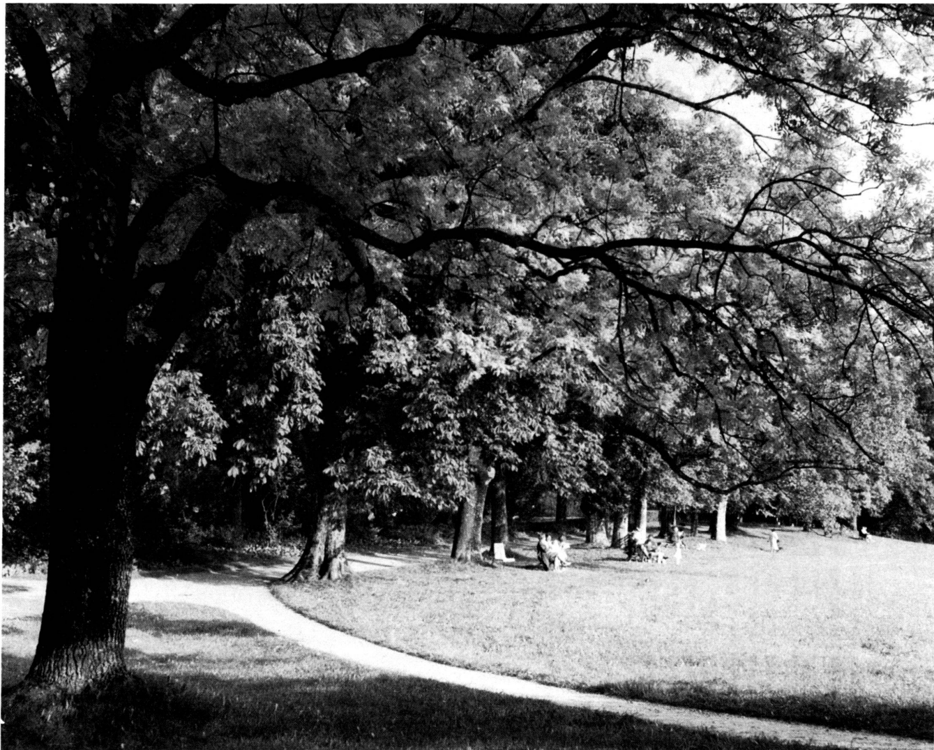
Summer in the Elfenau Park.