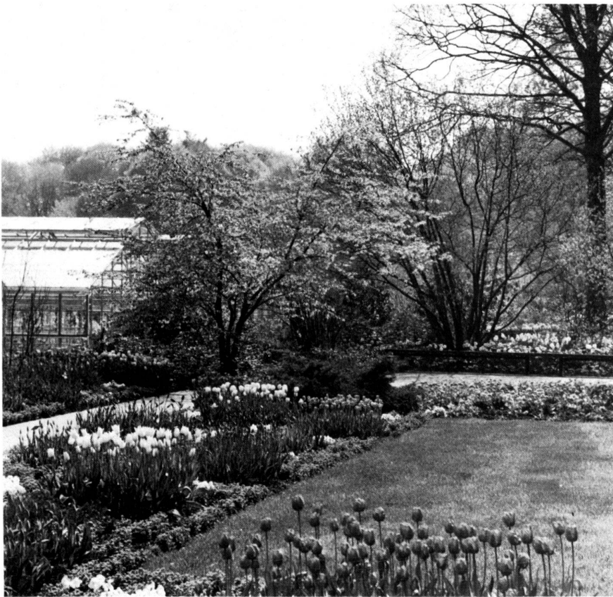
Frühlingsblumenparade im Nahbereich der Stadtgärtnerei im Elfenaupark.