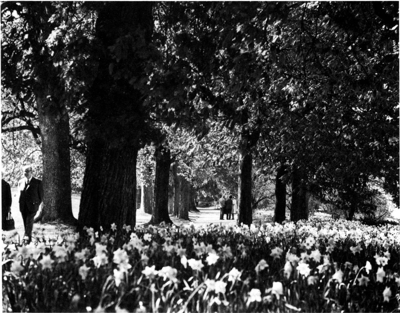
Reicher Frühlingsflor im Elfenauпарк.