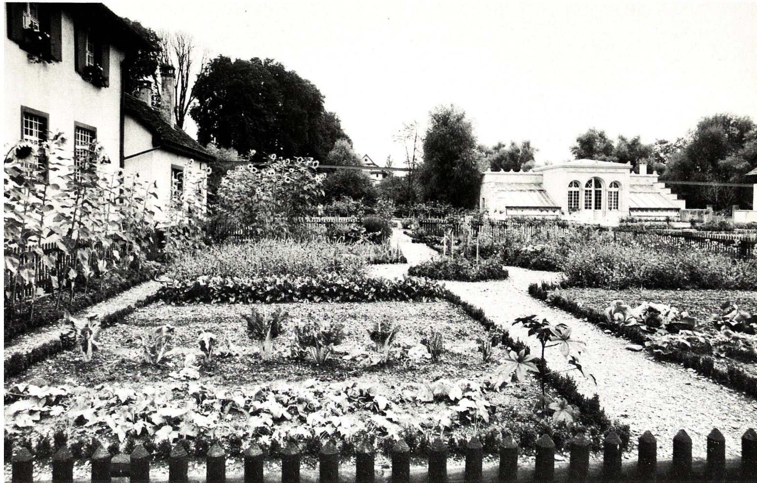
Der Bauerngarten im Bereich der historischen Gärten im Gutsbetrieb Brüglingen.