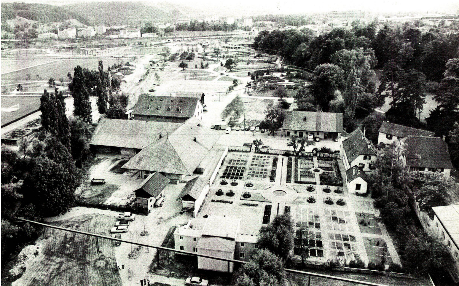
Der Sektor «Säen und Ernten» aus der Vogelschau im fortgeschrittenen Baustadium 1979.

Located to the north of the farmstead, the orchard is reserved for keeping small domestic animals.