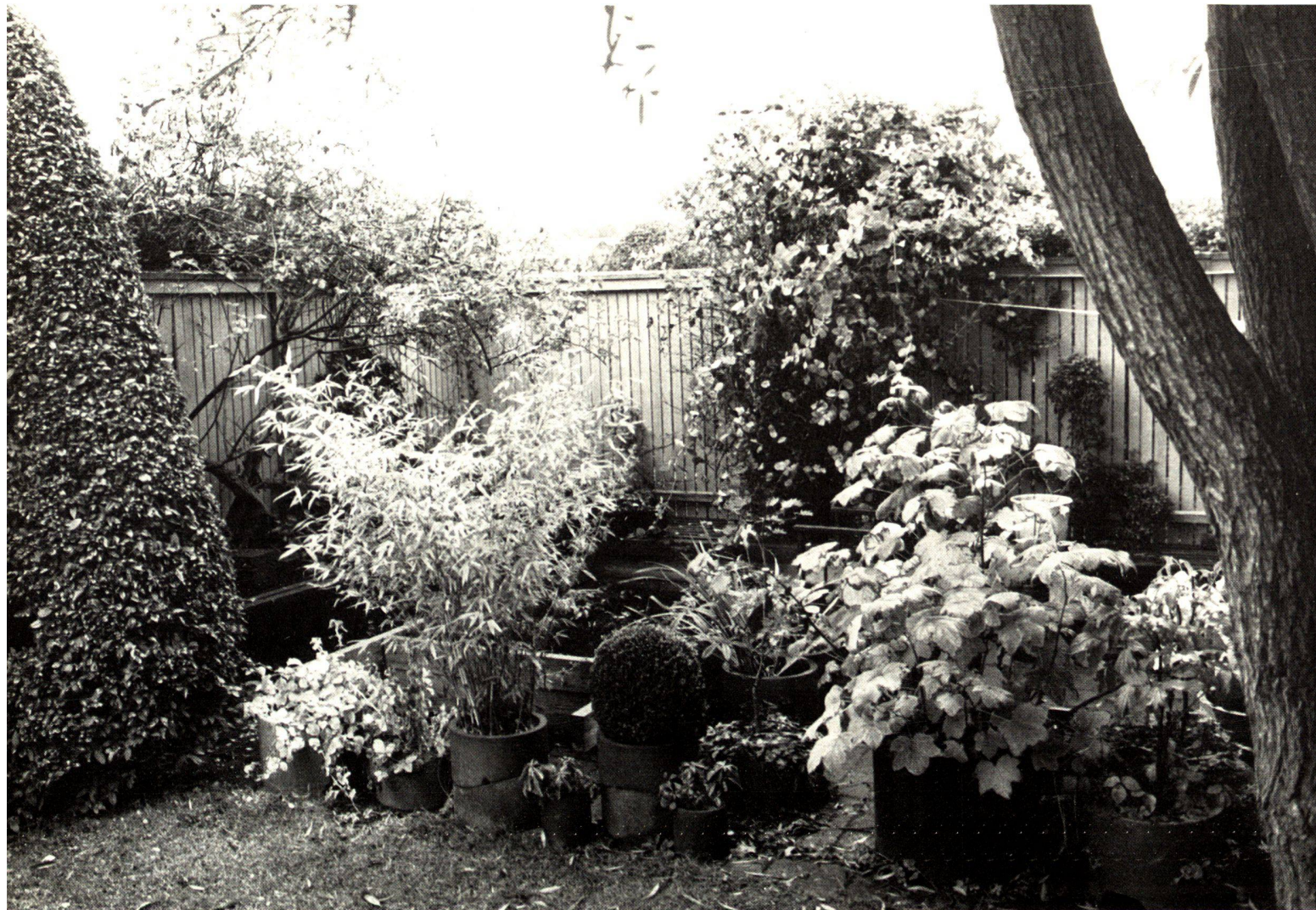
Wie hübsch kann doch eine kleine Pflanzensammlung in Gefässen sein!