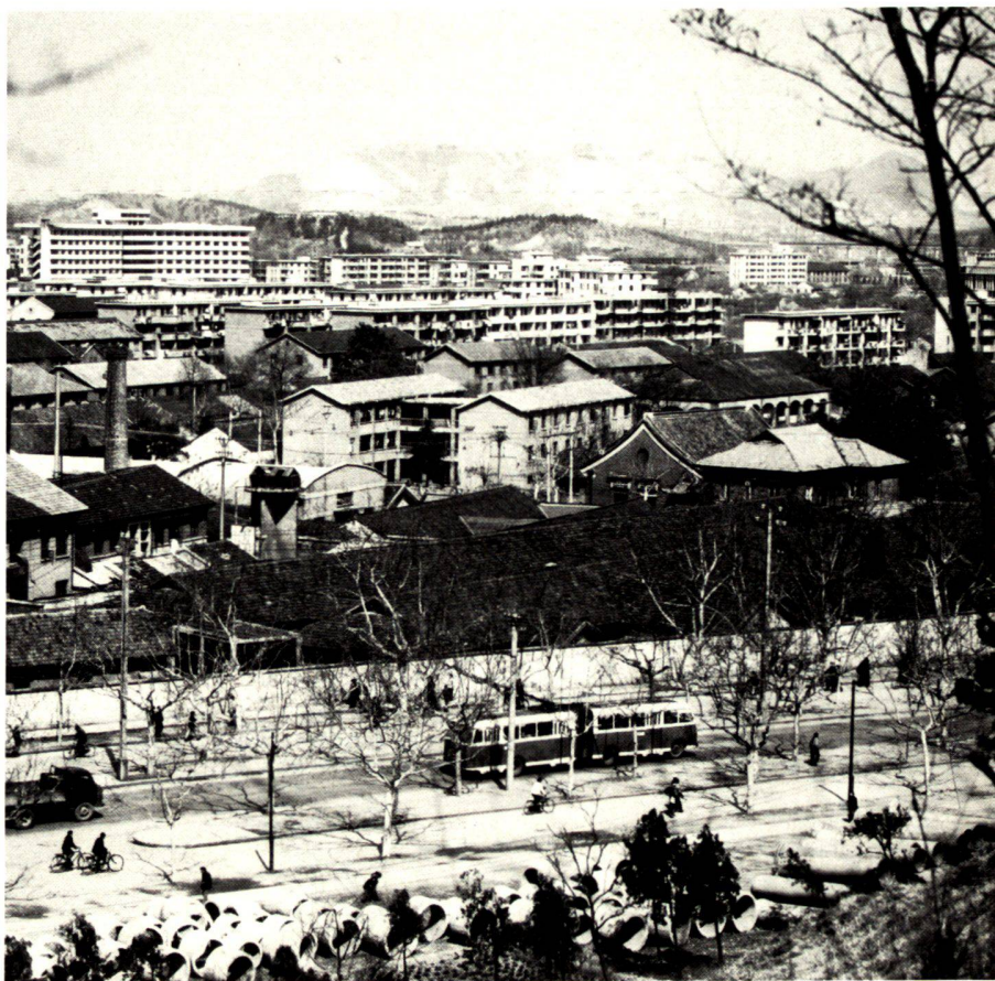
Modernes Stadtbild von Nanjing (Nanking) — kaum ein Unterschied zu unserer Architektur.