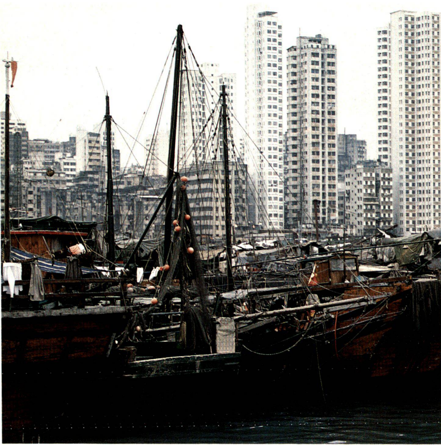
Hongkong — Besiedlungsdichte, Leben auf dem Land und Wasser.