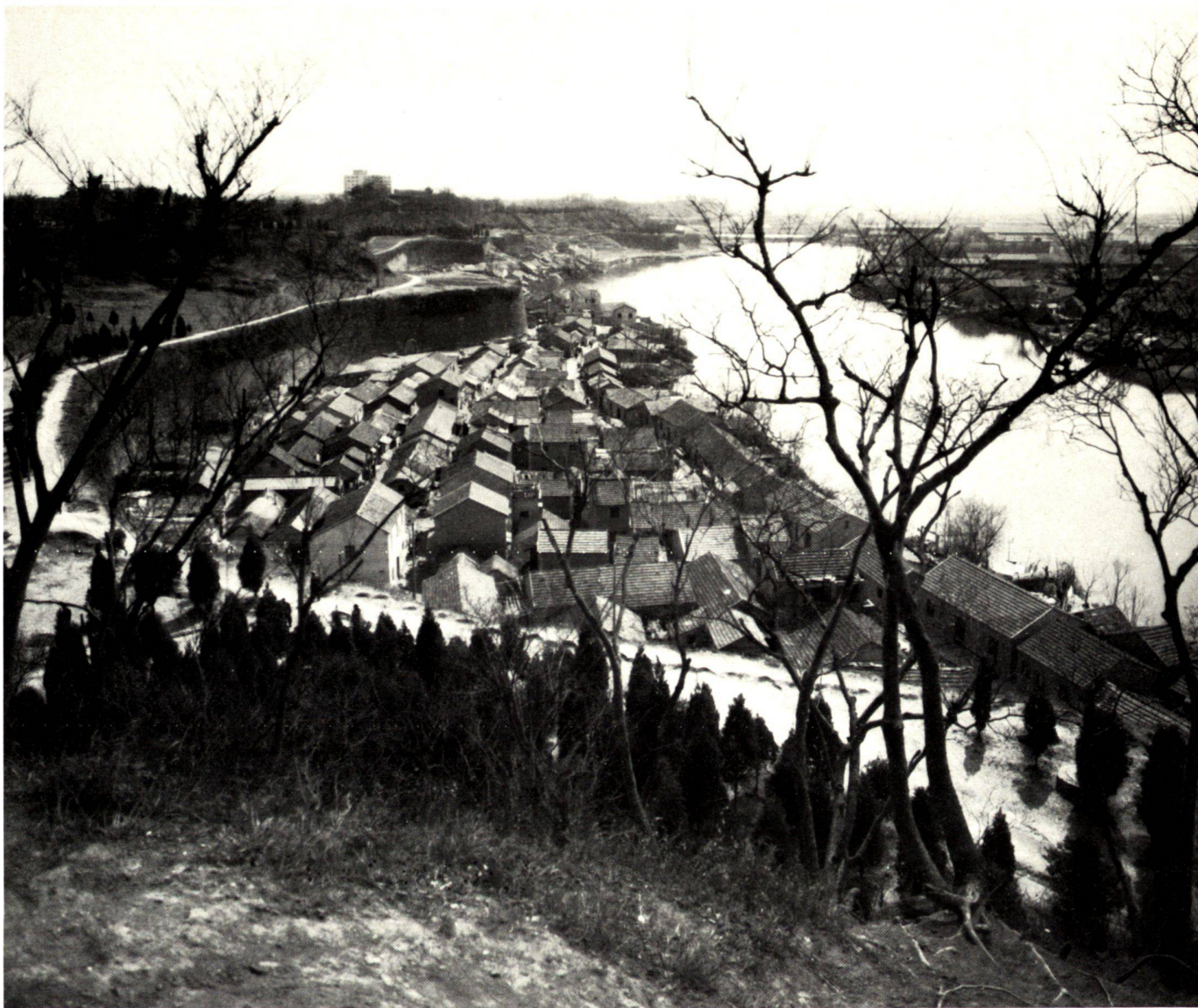
Siedlung am Flussufer in Nanjing (Nanking) — ausserhalb der alten Stadtmauer.