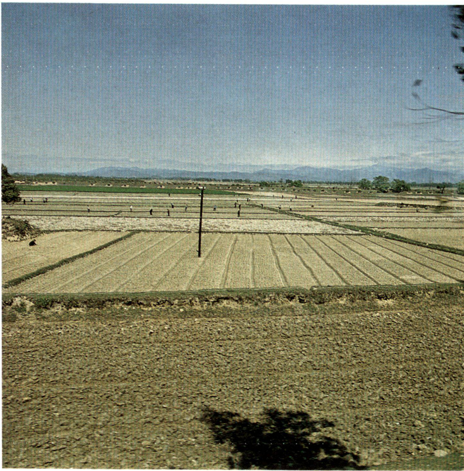
Deltalandschaft. Zone du Delta. Delta landscape.

chen Maschinen auf den Feldern. Praktisch alles wird in Handarbeit erledigt. Wasserbüffel zogen die Pflüge, in Körben wurde der Dung und Kompost ausgetragen. China erzielt mit dem geringsten Energieaufwand zurzeit sicher die grösseren Hektarerträge als wir.