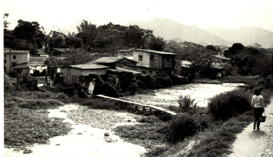
Hongkong — New Territories, Vorstadtlums.

Men stacked like battery hens and men on junks and sampans. Some of them on the beautiful slopes in bungalows — others in tin shanties, also on the slopes above the sea. A professor commented: «The striking overgrowth of mountain slopes and tops cannot be explained by a lack of building space alone; it is the consequence of an obviously missing or inadequate building ordinance in conjunction with widespread property speculation . . .»?!