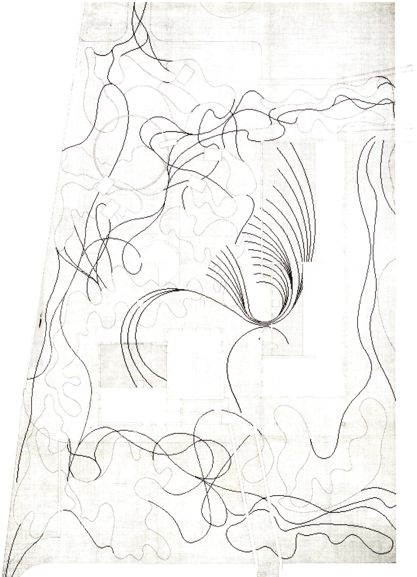
Grundrissplan für den Belag auf dem Postplatz im «Städtle» von Vaduz/Fürstentum Liechtenstein.