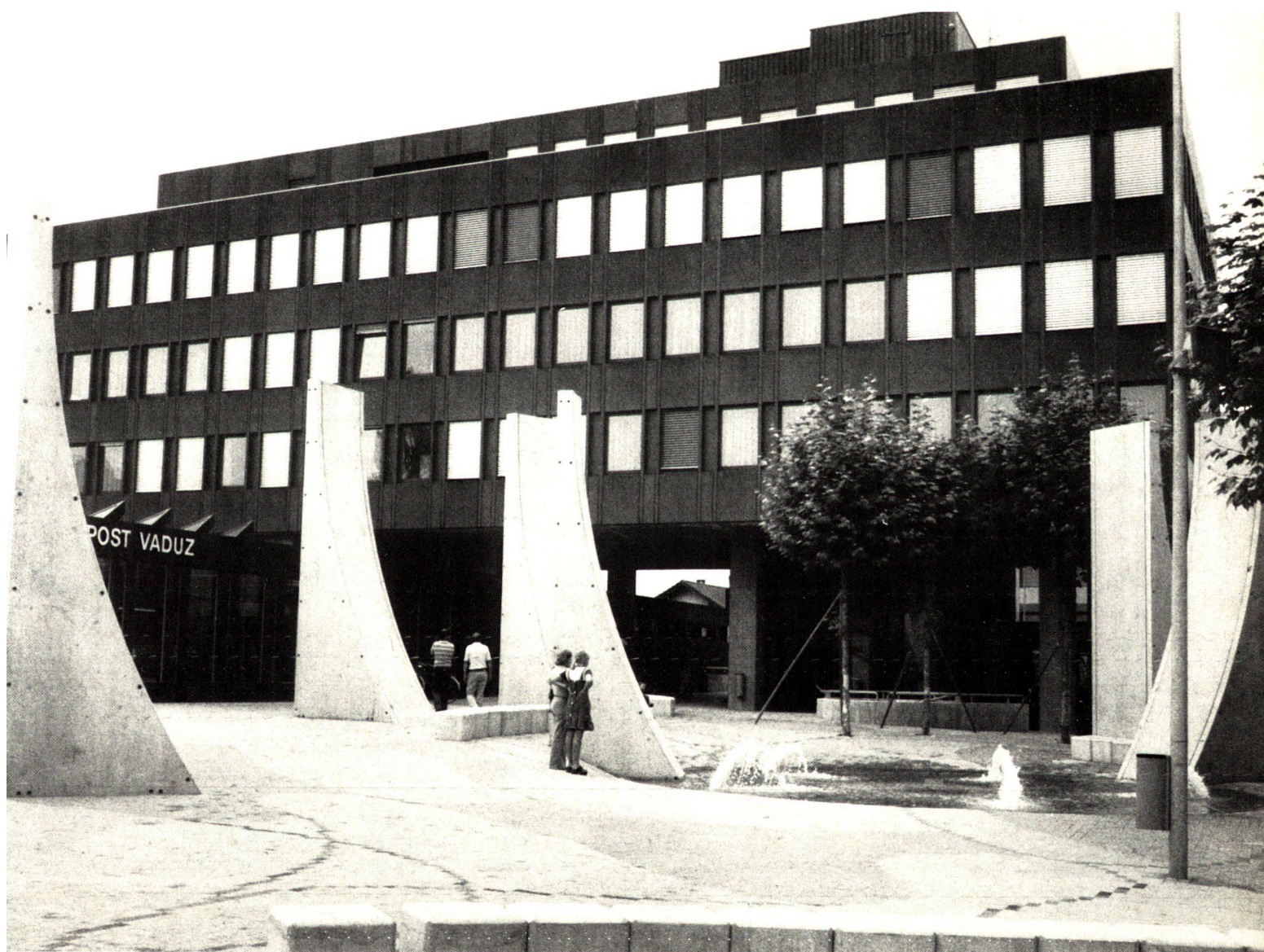
Postplatz in Vaduz mit den vom Gartenarchitekten und Platzgestalter geschaffenen, um einen flachen Teich gruppierten Betonelementen.

The Postplatz at Vaduz Design: E. Cramer, Garden and Landscape Architect BSG SWB, Rüschlikon ZH