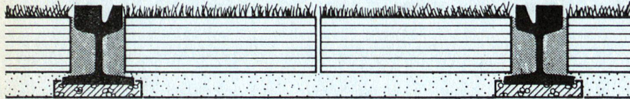
Begrüntes, befahrbares Tramtrasse Entwicklung und Ausführung: Trachslag AG, Sihlbrugg