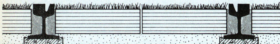
Begrüntes, befahrbares Tramtrasse Entwicklung und Ausführung: Trachslag AG, Sihlbrugg