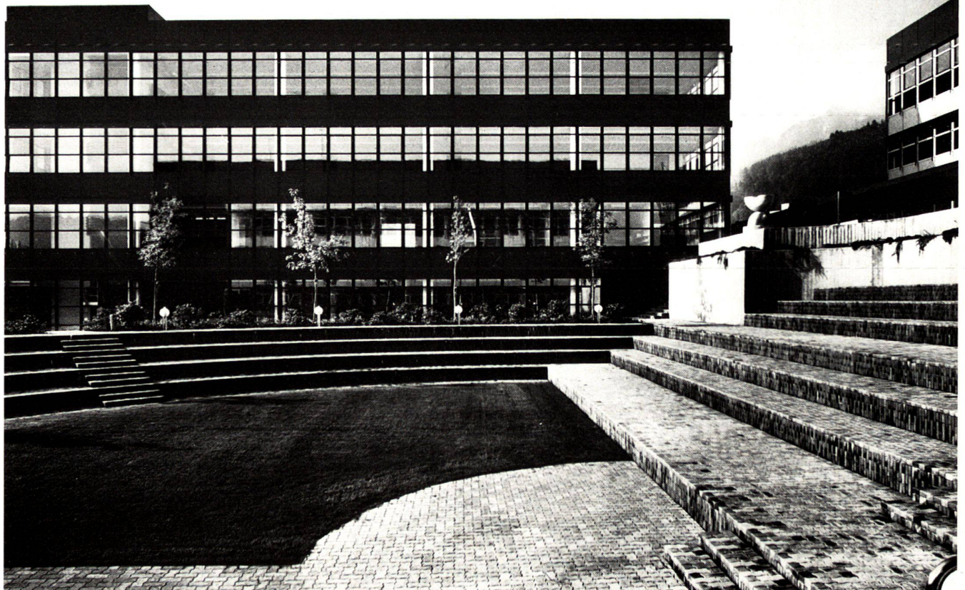
Teilansicht des Innenhofs des Zentralschweizerischen Technikums in Horw.

School courts are used for rest, discussion and for study out of doors. The precondition for frequent use are its ready accessibility during breaks, protection against the wind and sunny and shady seats at all hours of