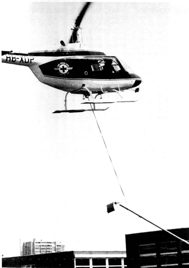
Links: Anfliegen der Beleuchtungsmasten mit dem Helikopter.