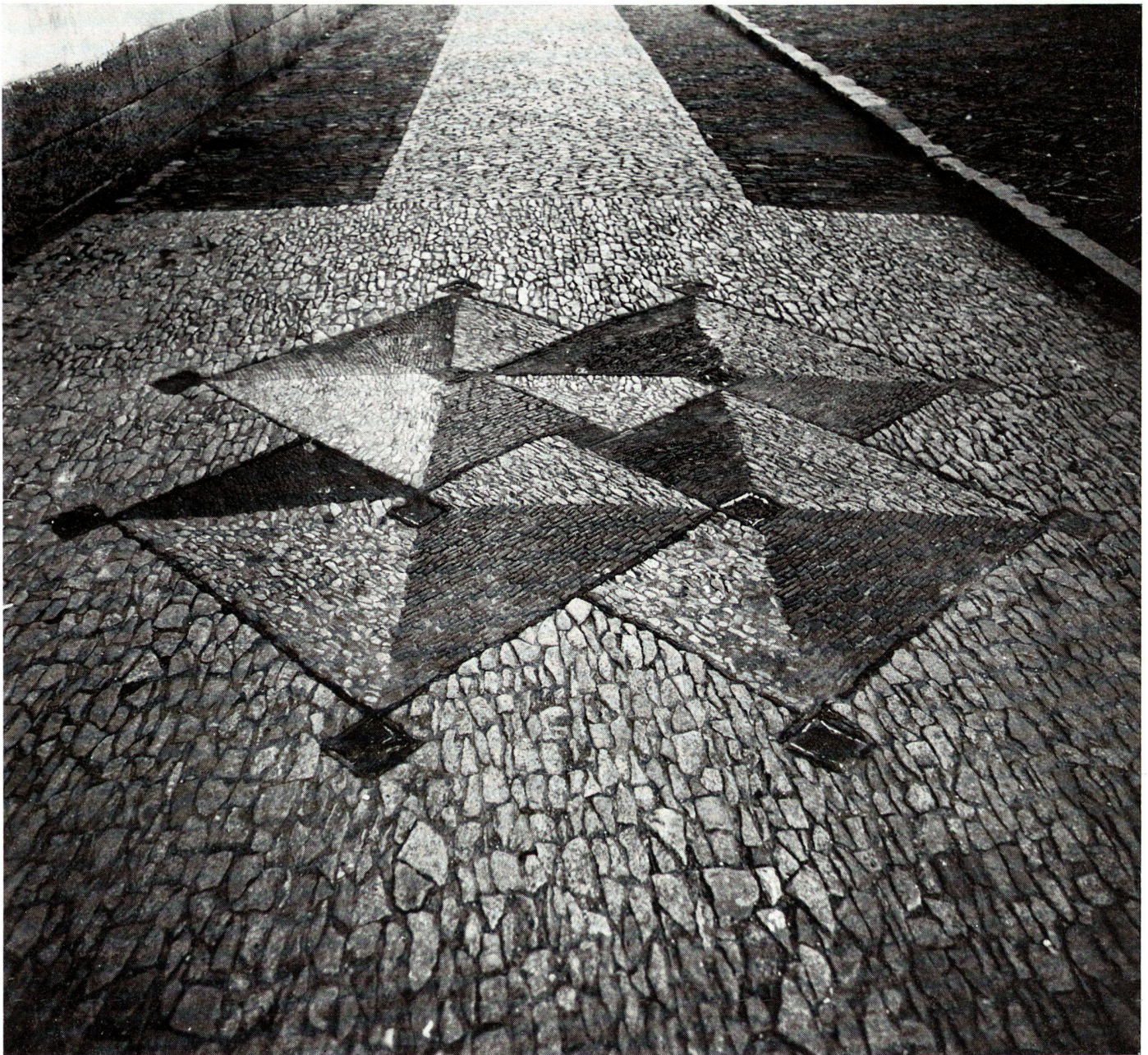
Paviment-Motiv eines chinesischen Gartenweges. Steinmosaik von ineinandergeschobenen Quadraten.