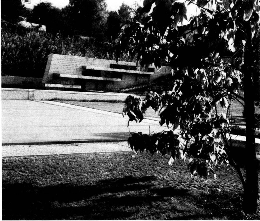
Einlaufpartie der grossen Brunnenanlage.