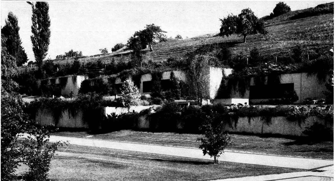
Oben: Ausblick über das Urnengrabfeld zur Abdankungshalle und Kirche.