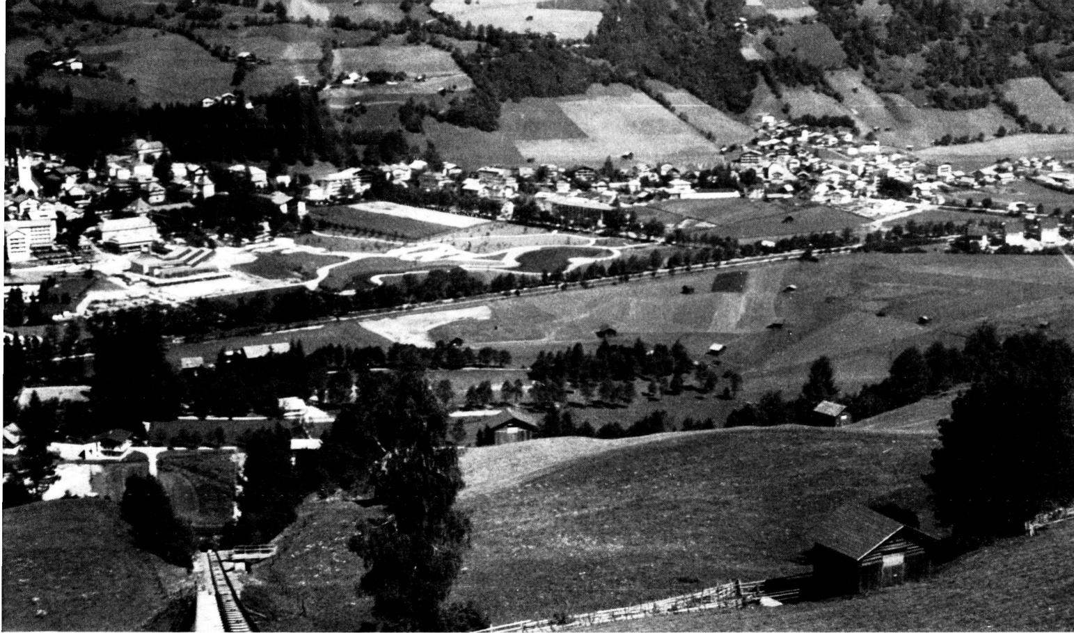
Blick auf Bad Hofgastein mit dem neuangelegten Erholungspark zwischen dem Ortszentrum (links im Bild) und der von Gehölzen begleiteten Gasteiner Ache.