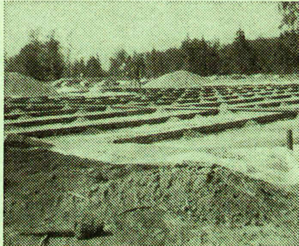
Aufbau einer untergrundunabhängigen Grünfläche mit Hilfe des Cell-Systems.