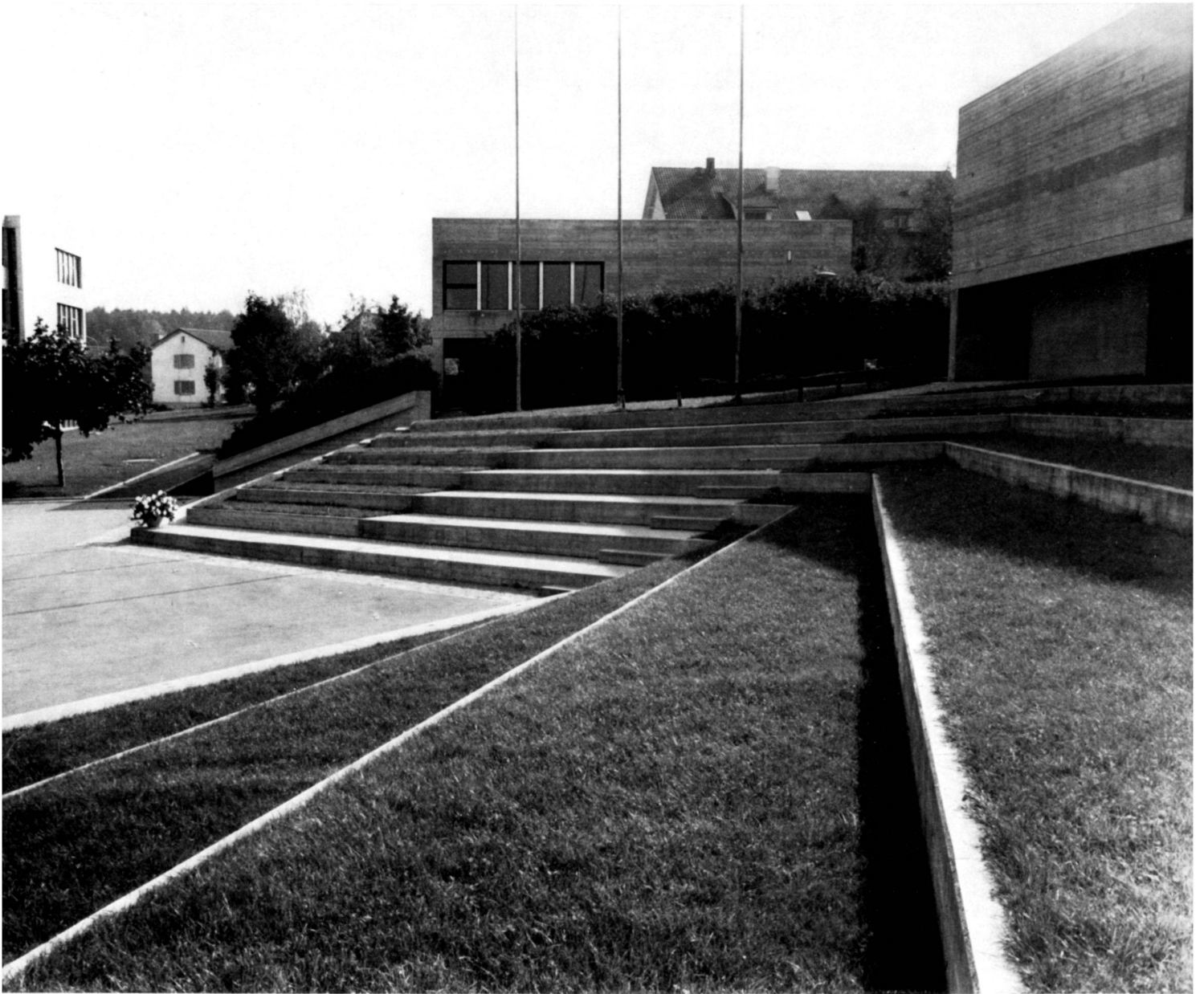
Pausenplatz mit Rasentreppe zum Schulhaus Looren in Witikon/ZH. Bild: HM