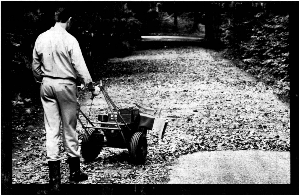
Die Parker Hurricane Blasmaschine säubert Wege und Plätze rasch und gründlich.