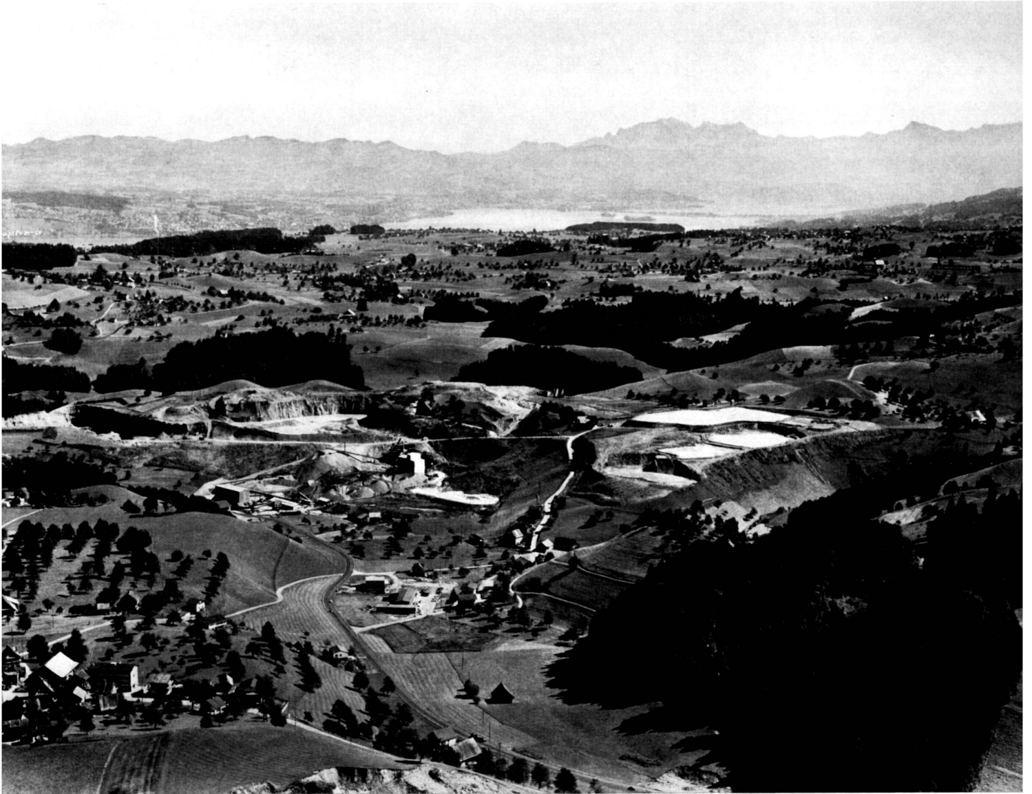
Abbauebiet in der Moränenlandschaft bei Neuheim ZG.