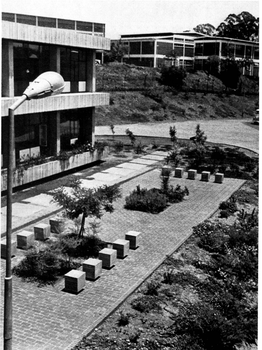
Deutsche Schule in Johannesburg/Südafrika. Teegarten für Lehrer beim Schulgebäude. Es wachsen hier schattenspendende Bäume heran. Gestaltung: Ben Farrell, Garten- und Landschaftsarchitekt M.I.L.A., Pretoria/Südafrika.