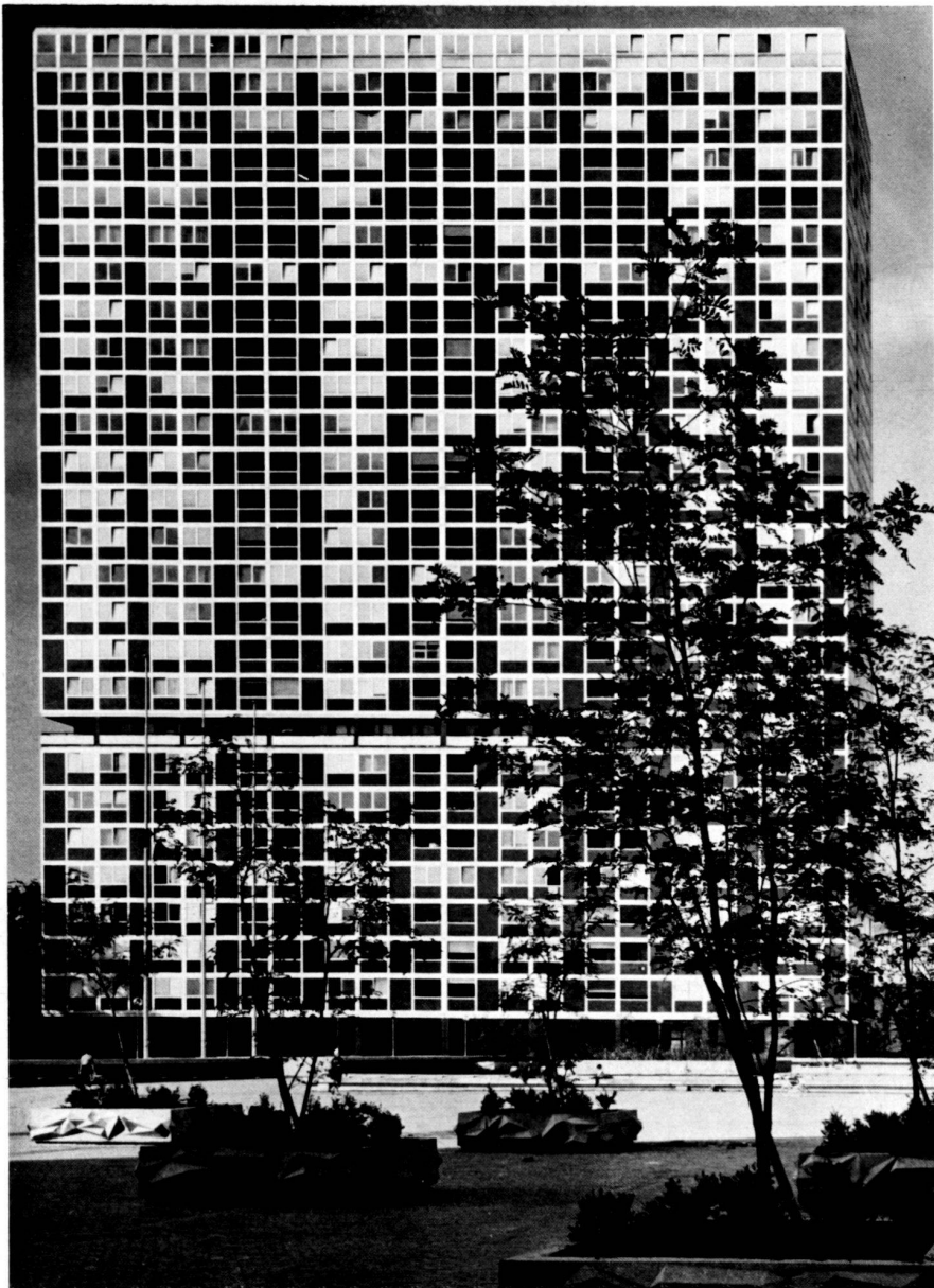
◀ Platzgestaltung zwischen den beiden Hochhäusern an der Rhone.

Schulen, öffentlichen Gebäuden und Verbindungswegen.