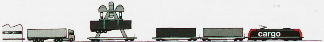
Unaccompanied combined traffic: Semi-trailer