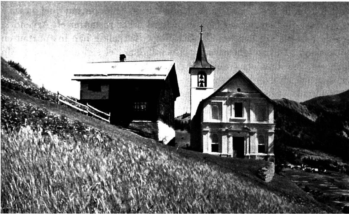
Cumbel, caplutta da S. Murezi, Valgronda

neutier la crappa sil plaz destinau. Mo mintga damaun fuva la crappa naven. Mond suenter fastitgs, han ins anflau ella leuora sper la tuor dil casti. Ins tegn cussegl e vegn perina, da far aunc treis dis l'emprova. Sch'ils spërts laschien era quellas notgs buca la crappa cunbien, seigi ina segira enzenna, che la baselgia audi leuora sil con dil casti. E pilver, notg per notg mava la crappa naven. Aschia ei il sanctuari vegnius baghegiaus sper la tuor dil casti e quella survescha aunc oz da clutger. 9