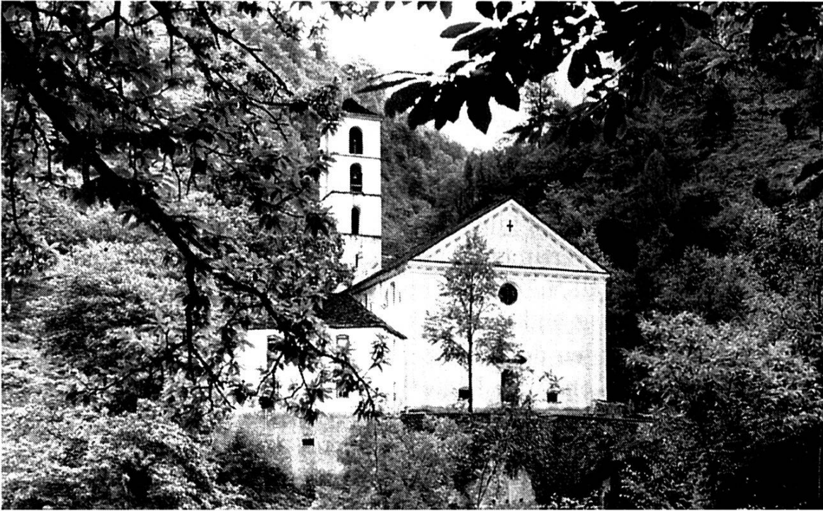
Roveredo, La Madonna del Ponte Chiuso

Ella val da Castiel el Scanvetg viveva pli baul in stermentus dragun. Quel pretendeva mintg'onn in'unfrenda ord la populaziun dil vitg. La finala ei in um curaschus e da statura giganta sepurschius da mazzar il monster. Quei ei era reussiu. Ed el liug dil cumbat stat oz la baselgia da Castiel. 85