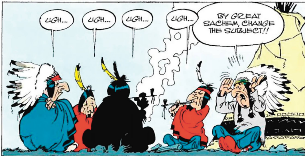
Illustraziun 6: «Ugh, ugh» tar Lucky Luke en anglais (De Bevere & Gosciny 2009: 3).