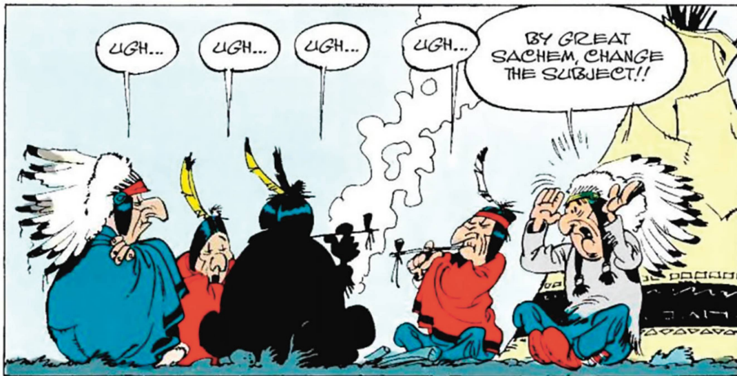
Illustraziun 6: «Ugh, ugh» tar Lucky Luke en anglais (De Bevere & Goscigny 2009: 3).

L'ipotesa che Giacun Hasper Muoth haja scrit il text Trentatschunc onns en l'America , escluda l'editur da l'ovra cumpletta da Muoth, Leo Tuor. 23 Enfin ch'il manuscrit dal text resta sparì, èsi dentant grev da sclerir tgi che pudess avair contribuì essenzialmain al rapport da viadi da Ludovic Cathomen.