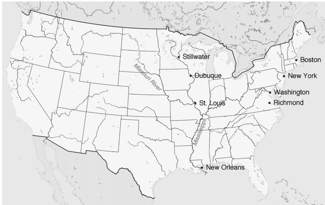
Illustraziun 1: Lieus impurtants en Trentaschunc onns en l'America da Ludovic Cathomen (1904).