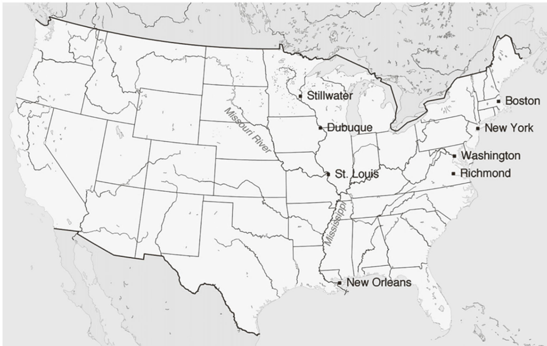
Illustraziun 1: Lieus impurtants en Trentaschunc onns en l’America da Ludovic Cathomen (1904).