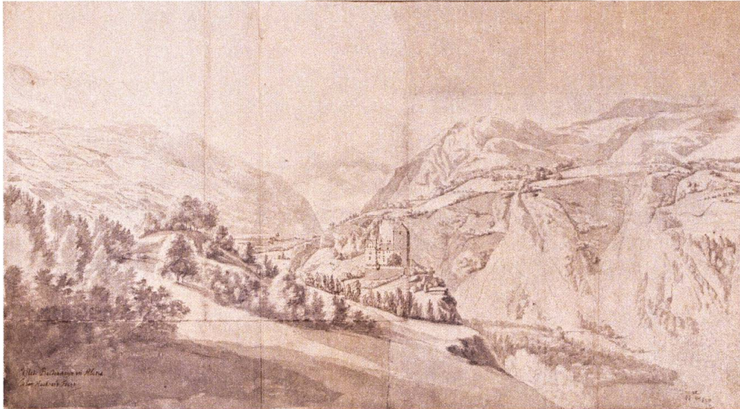
Vista da la Mantogna dil 1655 dal chastè Campi anen (dissegn da Jan Hackaert, Museum retic Cuir).

rumantsch. Malgrà il stgazi da plets limità sajan intginas registraziuns citadas: