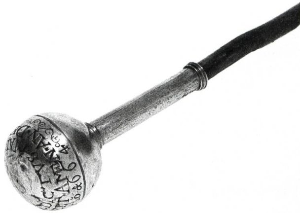
Batgetta da dretgira da la Mantogna (Museum retic Cuir).

giudiziala da la Lia sura. 12 Diesch onns pli tard ha Johannes Stumpf rapportà en sia cronica dal 1548 davart ils «Rhetier»: