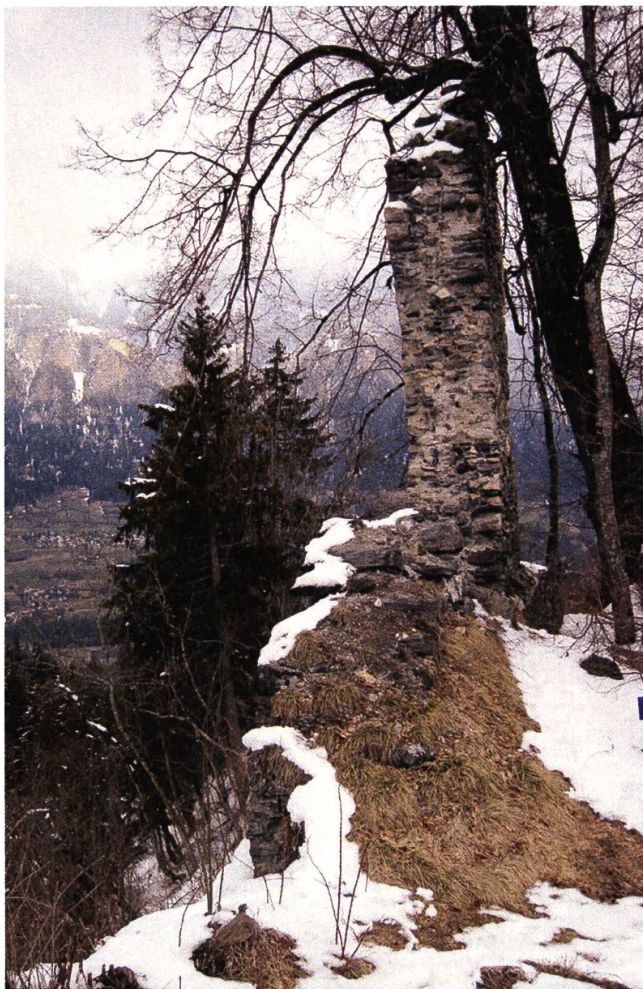
Ruinas da la veglia baselgia da Purtagn.

bustabs pitschens predominescha. Sulettamain nums da persunas e lieus vegnan scrits grond. Tar la scripziun unida respectivamain separada vegn duvrà per part l'ortografia moderna per facilitar la chapientscha. Quai vala era per l'interpuncziun originala rudimentara, nua ch'i na dat frappantamain nagins apostrofs.