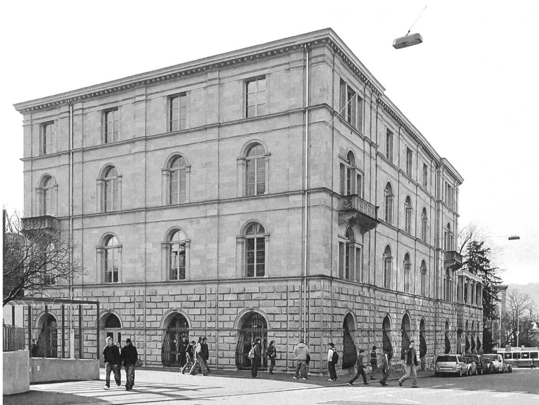
L'edifici odiern dal Seminari da romanistica.