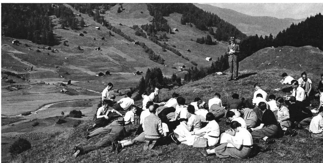
Referat dad Andrea Schorta or il liber.