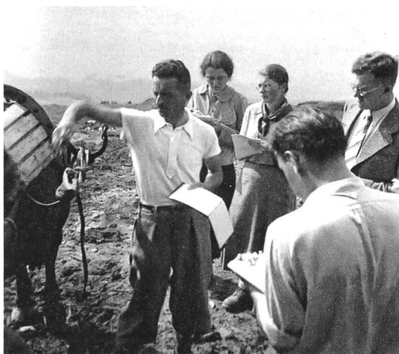
Ils students da Jakob Jud fan registraziuns dialectalas a Breil e conturns cun intervistas e disegns, a dretga sin l'Alp Quader.