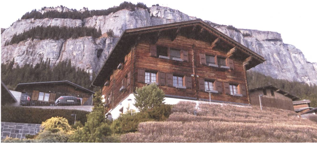
Anteriura casa da scola da Fidaz avon il Crap da Flem