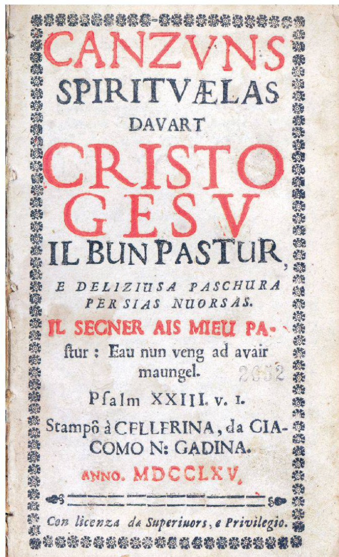
G. B. Frizzoni: Canzuns spirituaelas, 1765, frontispizi

ella fa part da la musica vocala sacrala cumpilada eclecticisticamain e da la musica da diever concepida per finamiras teologicas e pedagogicas.