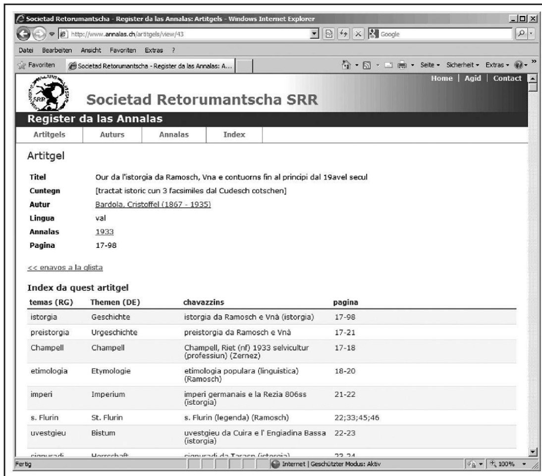
fig. 2 Vista da detagl dad in artitgel