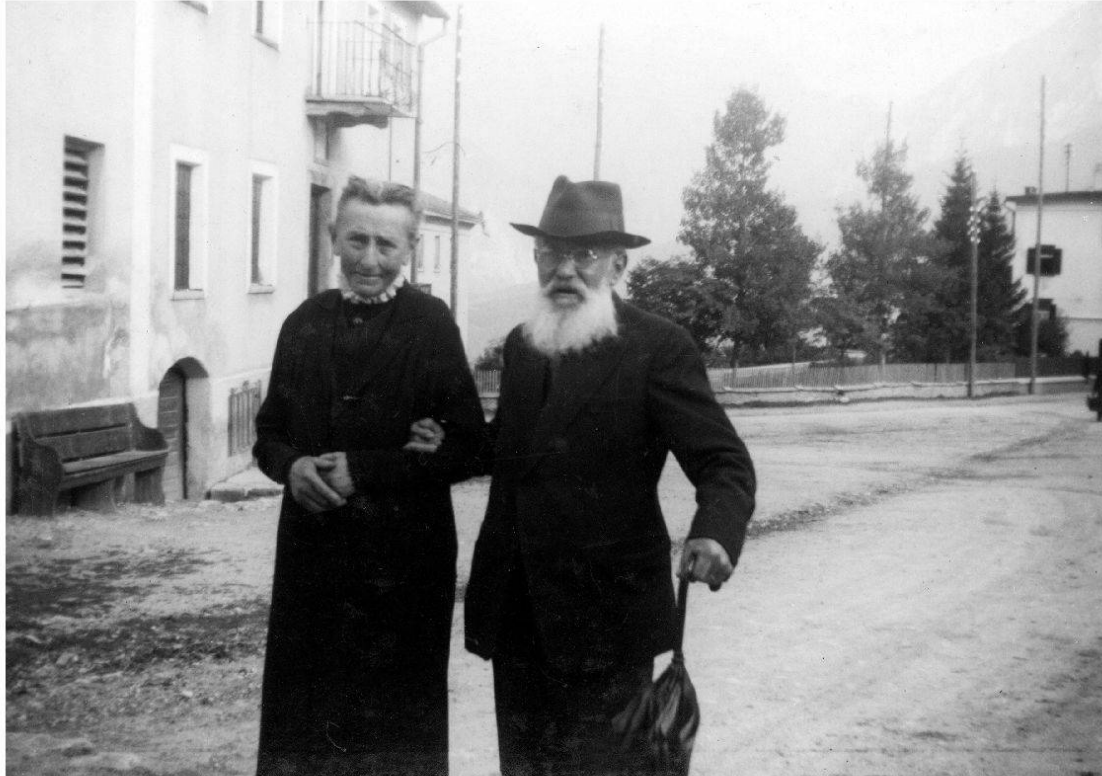
Andrea Vital (1855–1943) ei staus il secund president dalla SRR (1898–1925)

dalla suprastanza 16 che sorprendan las scharschas (invitaziun, menu, musica). Las radunonzas generalas vegnan enramadas cun produenziuns da cant dils scolars cantunals, e differentas gadas dattan ins era in toc teater per il publicum. Quellas activitads ein signadas d'in cert spèrt patriotic ch'era presents el Grischun ils onns ch'ins ha preparau e realisau la commemoraziun dalla battaglia dalla Chalavaina. 17 En quellas radunonzas espriman ils participonts era lur ideas partenent la cultivaziun, la purificaziun ed il diever dil lungatg, e temas sco la posiziun dil lungatg en scola ed ell'administraziun vegnan adina puspei ventilai. 18