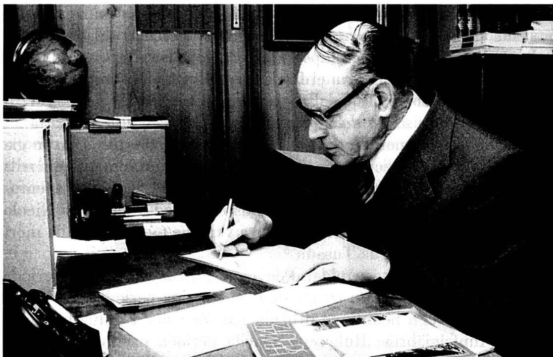
En casa pervenda da Cumbel ils 22 da mars 1978