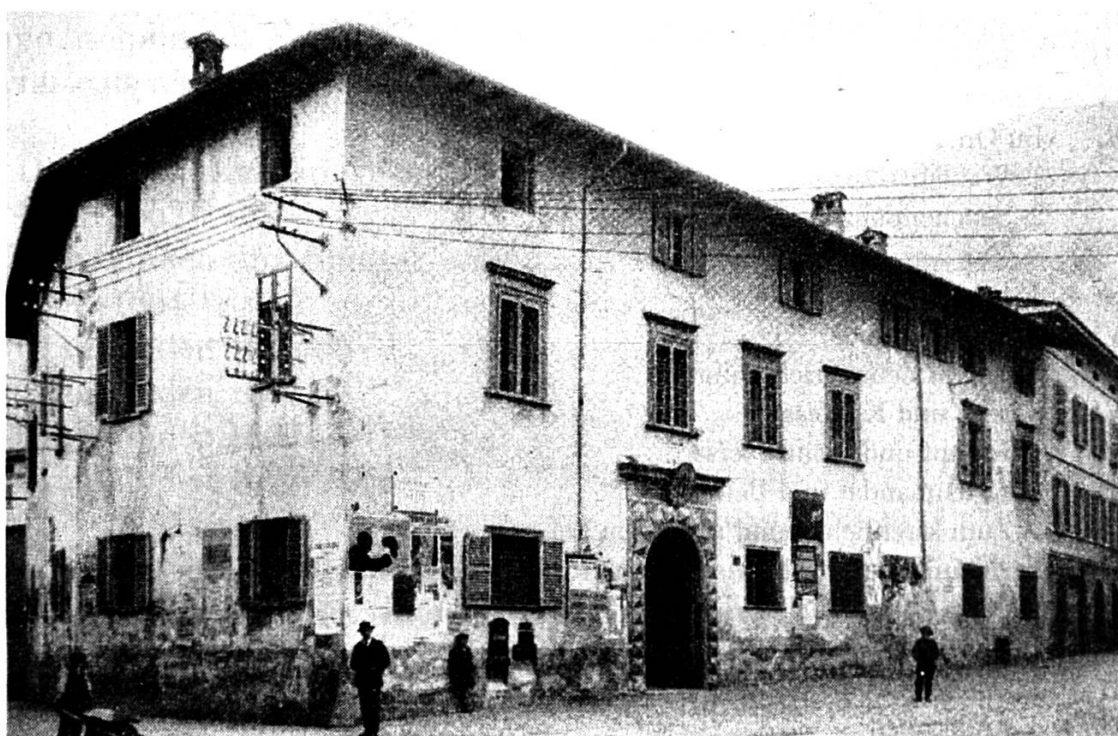
Il palazzo dil guvernatur grischun a Sondrio 21