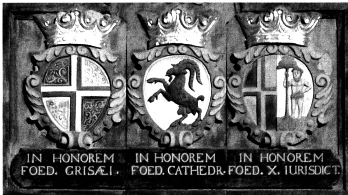
Ils emblems dallas treis Ligias 9