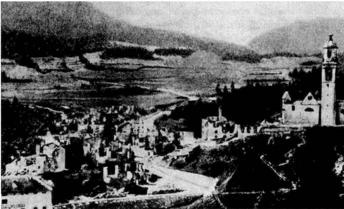
Casti an ruignas, siva igl incendi digls 11 da matg 1890. Ni baselgia ni tgesa pravenda èn neidas preservadas.

Arsa giu è squasi l'antiera part soura dalla vischnanca. Causa dalla favognera vehementa èn la flommas er sgladas vease tar la