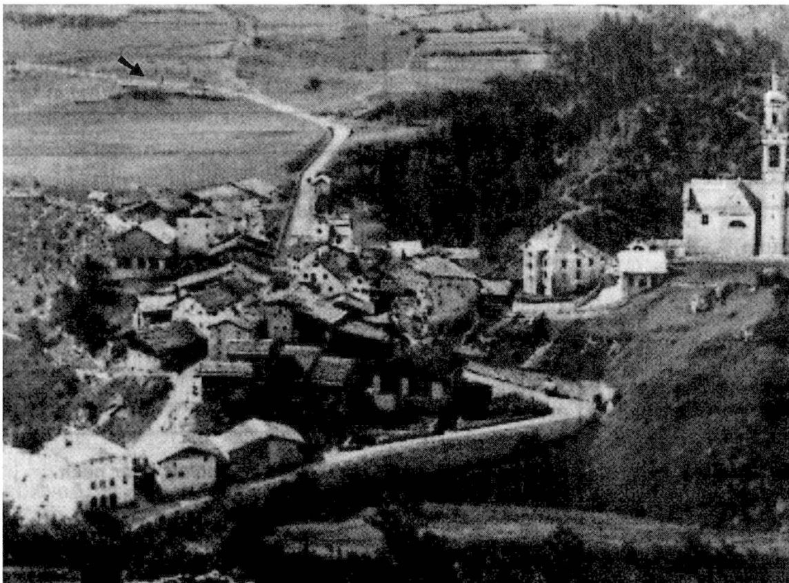
Casti anturn igls 1860.