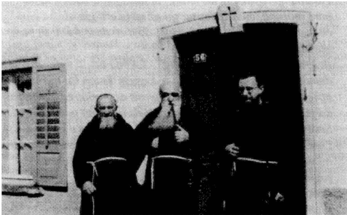
Or da Igls caputschins a Salouf da G. P. Thöni

Cun P. Daniel sa sera oramai igl gross codesch cun l'istorgia digls paders dalla Missiun da chels caputschins da Brescia an Rezia. En ventirevel destin ò pero pussibilito igl arranschamaint cun la provinza digls caputschins tessines da Madonna del Sasso a Locarno,