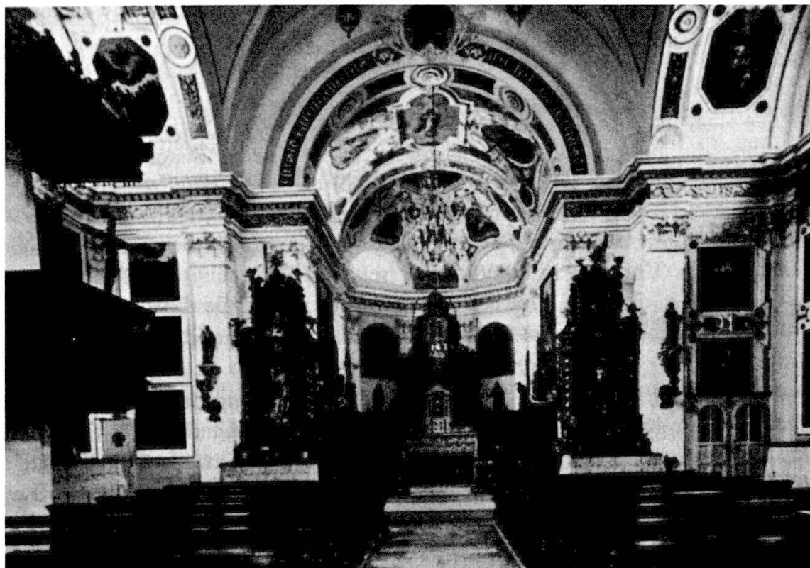
Maletg: Istorgia da Casti da G. Sigron

tost igls refurmos, pro Frantscha, tscho, per gronda part pro Spagna/ Austria igls catolics; na, per gronda disgraztga è 1629 er puspe rot or la pesta, tgi ò fatg ena sdratscha exorbitanta er tar nous. 40