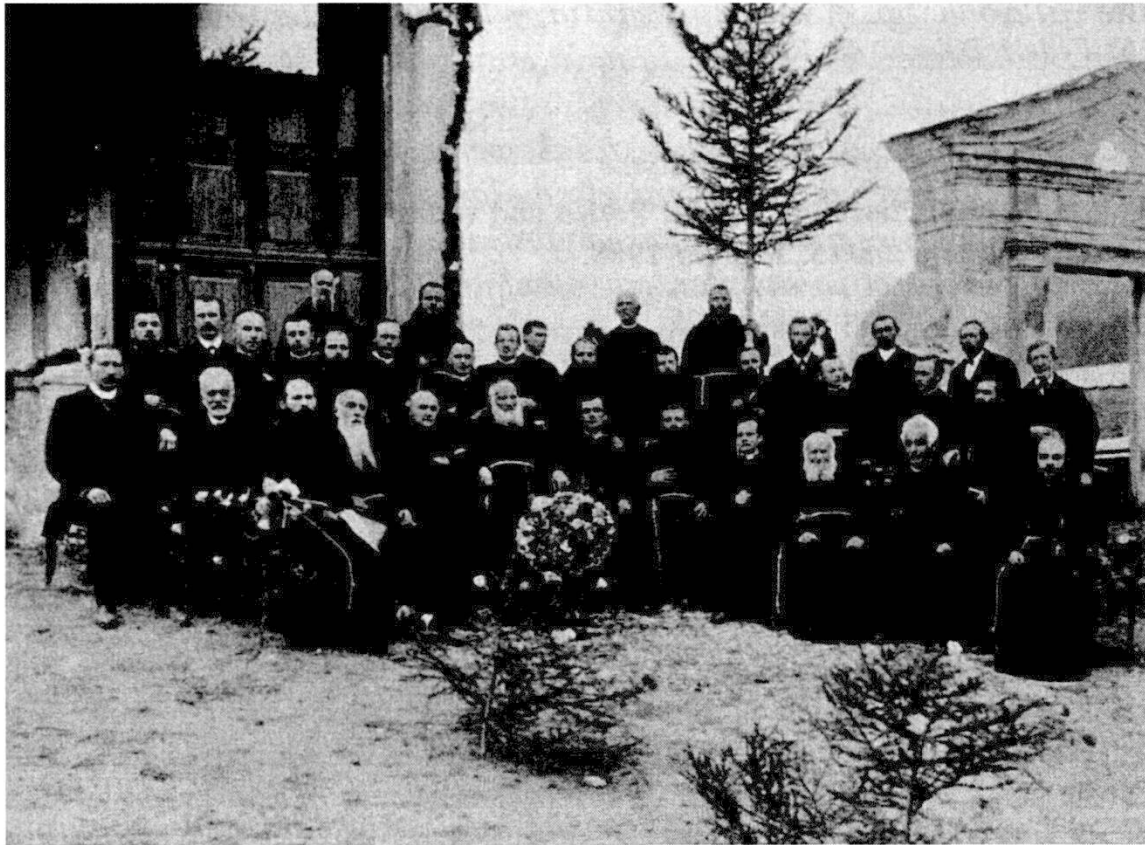
Or da Istorgia da Casti da G. Sigron

an cunsientga («conforme il dettame della sua coscienza»), tgi a chels missiunaris, stond els lò noua tgi els eran mess, i seia ansomma nun-pussebel da pudeir veiver u far ensatge digl bagn sainza ageid da danner. Digl qual, igl rimnond an martgeas catolics scu Milang, Brescia, Bergamo, Puntina (Innsbruck), els sa siervan franc betg per els sez, scu chegl tgi gl'era nia rapporto cun manzignas. Ed igls raps derivavan savens d'enqual bung e fidevel amei e sainza scandal, uscheia tgi els igls impundevan angal cò an Rezia, chegl tgi era er sto concedia antras la Sacra Congregazione sezza.