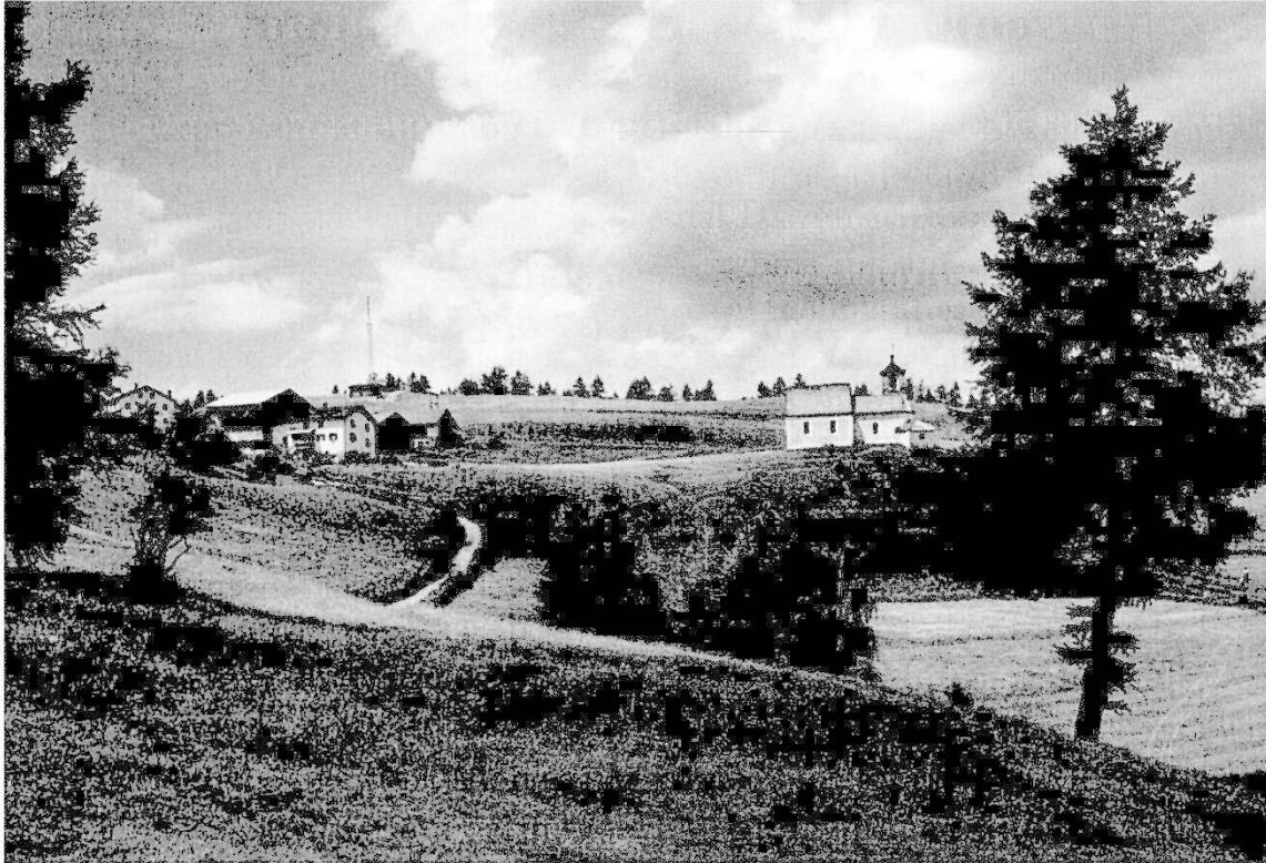
La fracziun Del sur Salouf cun la baselgna construeida an 2 etappas, deditgeida a s. Roc, igl patrung cunter la pesta.

Er schi la parochiala a Salouf vign numnada per l'amprem'eda pir anturn igls 1290 34 dastg'ins supponer cun buna raschung, tgi sot chella dad oz ins cattedes per franc igls mussamaints per aglmanc egn bietg bler pi vigl. Chegl giond or d'ena confruntaziun cun otras «baselgias viglias», gist angal tar pleivs manevlas, p. ex. Stierva e Mon (s. Cosmas), noua tgi ellas èn gio documentadas per igls onns 800. Ed alloura zont risguardond d'ena vart igl fatg, tgi Salouf sa catava gio dall'èra romana ed anc pi tard dasper la veia da transit impurtanta, era da l'otra vart ena tscherta centrala antras lezza curt, – igl ampren sedia d'en administratour imperial, sessour digls func-