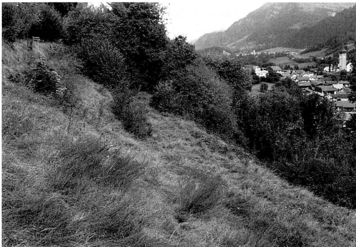
Las Sorts dad oz a Sagogn-vitg

partgius ora cumpeglia 1604 tschuncheismas ed ei dividius en tochets da sorts da 40 tochen 150 tschuncheismas ( 160 m 2 tochen 600 m 2 ). Denter ils 16 possessurs dev' ei tschun dunnas. Las sorts serepartgevan sur treis areals entadem il vitg dadens sur via: A Calnetg (oz: areal Corai e Nay), a Plaunca e sur Falégna (oz: Las Sorts). Ils beins partgi ora sco sorts vegnevan per part duvrai sco praus, per part sco ers; dils ers d'inaga dattan las restonzas da mir existentas perdetga.