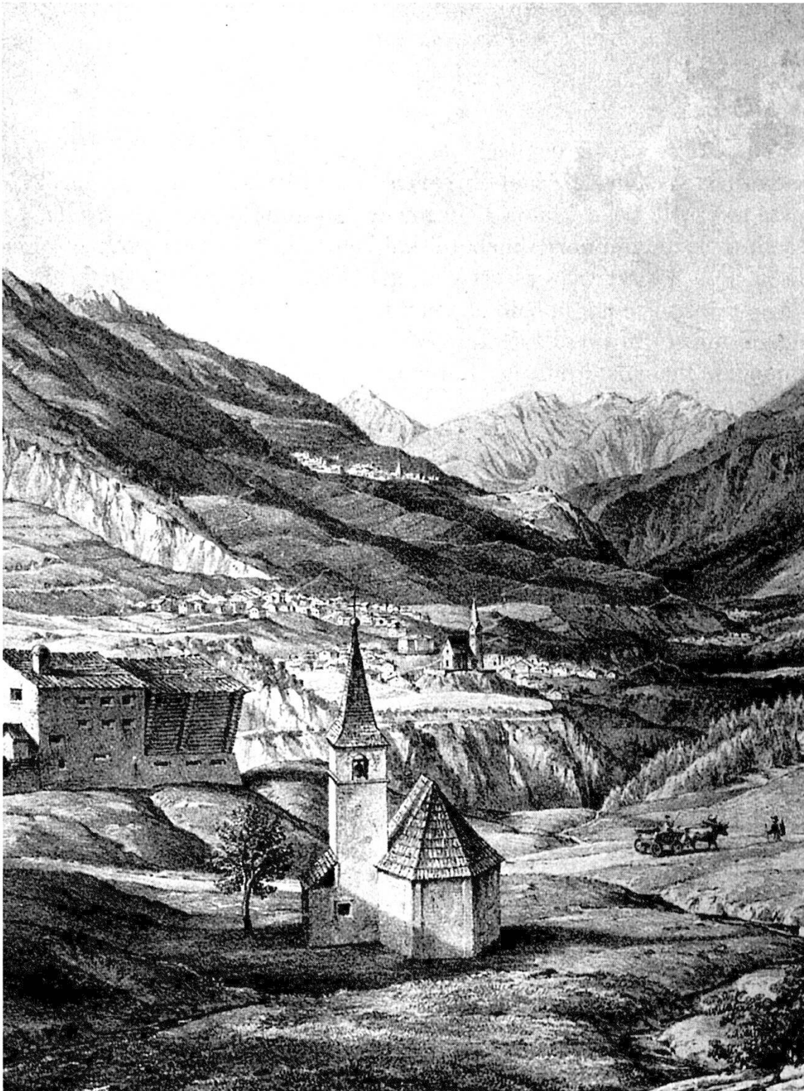
Gravura da Vulpera vers Scuol e Sent, intuorn il 1830

clostra da chasa dals signuors da Tarasp, la quala as rechattaiva il prüm a Scuol, e davent dal 1146 a Munt Maria survart Barbusch 4 .