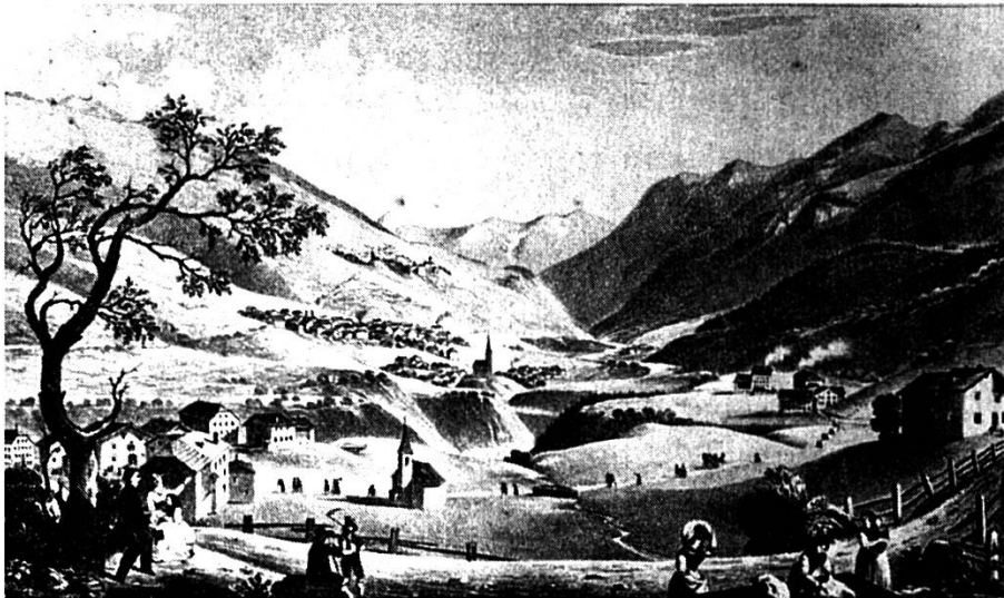
Gravüra da Vulpera Dadaint e Dadoura, intuorn il 1830

Las gabellas cumpressivas da Gulpera Suot sun: 151 \frac{1}{4} «March Käs» = 453 \frac{3}{4} noudas da chaschöl e 17 mozza üerdi. Feudatari es Luzi Giamara 16 . Probabelmaing cha quel es nat dal 1670 sco figl da Ludwig Giamara e Chatrina Rauner.