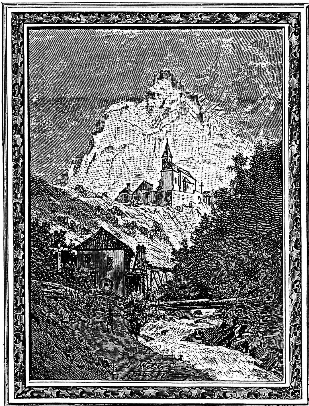
Il vegl muglin dal chastè