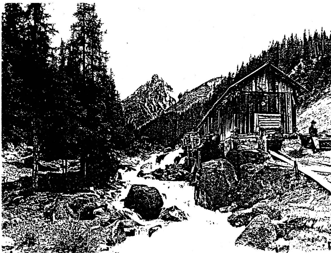
La resgia da Plauna cun l'auadottel