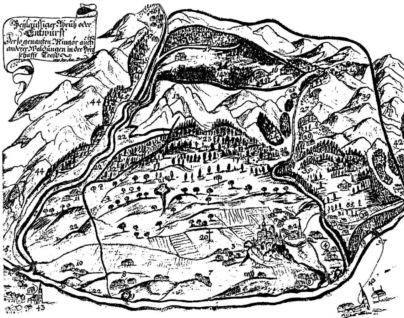
Disegn geografic da Tarasp e seis intschess. Quista carta as rechatta al «Voralberger Landesmuseum» a Bregenz e datescha dal 1722 o pac plü tard. Il titul original tuna «Beyläuffiger Abrüss oder Entwurf der sogenannten Ringör auch anderer Waldungen in der Herrschafft Trasp». Nr. 4 es Chaposch, nr. 6 Florins, nr. 29 Alp Laisch, nr. 32 Val Suort. Las proporziuns nu's cunfan.