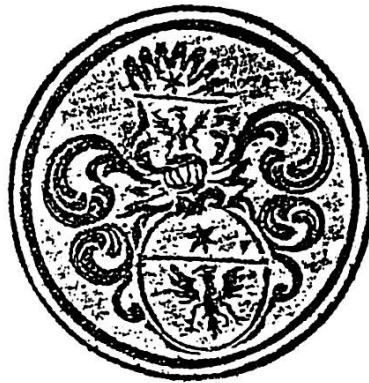
Vappa dals Juvaltas our da la broschüra dal 1777.

Quella nöblia chi vain da virtüd, brich artificiela, ella am maina in ot, muossa a mê pü scruder.