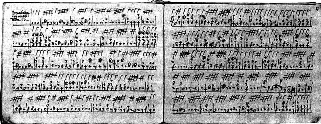
Illustraziun 4: Manuscrit da Samedan per lüt

Praeambulum exquisitissimum (canzona fantasia) ( illustraziun 4 ). El cuntegna diversas cumposiziuns sülla fundamainta dal tenor, las quelas as baseschan sün muostras d'armonia chi as repetan, ubain sün lingias dal bass, scu « De mogio chireenzian » (passamezzo antico), scupür töchs chi haun per fil üna simpla melodia p. ex. Swartz knab e Bentzinouwer tantz 11 . Elemaints medioevels tardivs as po scuvrir in Kochelperg tantz (basse danse) ed illa contrafactura da Stil wasser sind gern tieff (fauxbourdon).