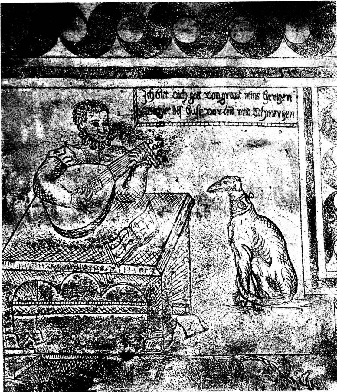
Illustraziun 1: Sgraffit da Vihavraun