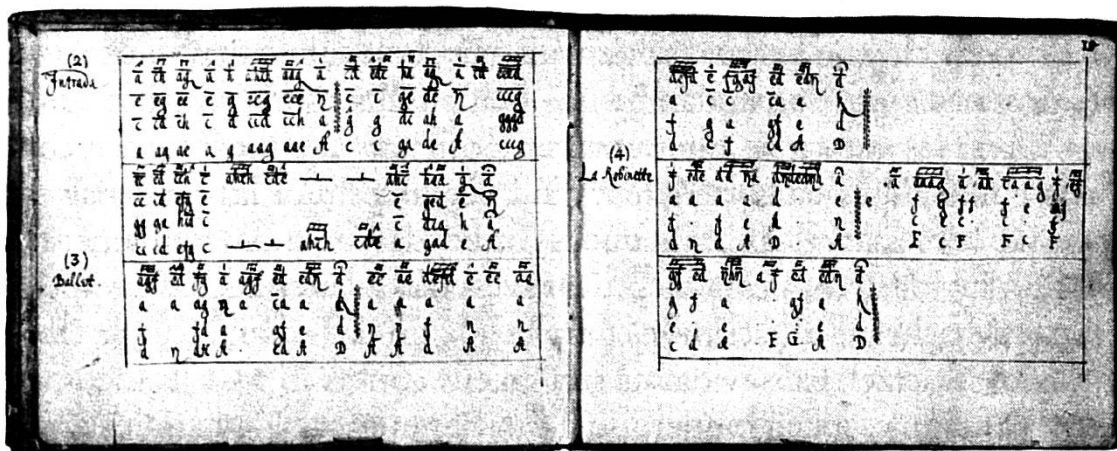
Illustraziun 5: Manuscrit da Zuoz per instrumaint a claviatura

tudas-cha dal 17avel tschientiner tampriv. Alchüns tituls tudas-chs e'l stil da la musica as cunfaun cun l'ediziun stampeda da Valentin Hausmann da l'an 1599 21 . Prubabelmaing cha la tabulatura da Wietzel es gnida copcheda d'üna funtauna chi cuntgniva «musica d'ensemble». Fich suvent es gnida scritta listessa nota duos voutas, in differentas vuschs, que chi nun es a sieu lö per ün instrumaint a clevs; percunter illa musica d'ensemble es que ün'appariziun frequentissima. Eir il möd da guider las vuschs, sumgiaunt a quel da la musica d'ensemble a quatter vuschs, scupür las inversiuns d'accords, difficilas da suner sün ün instrumaint a claviatura, sustegnan la supposiziun cha la funtauna saja steda musica d'ensemble.