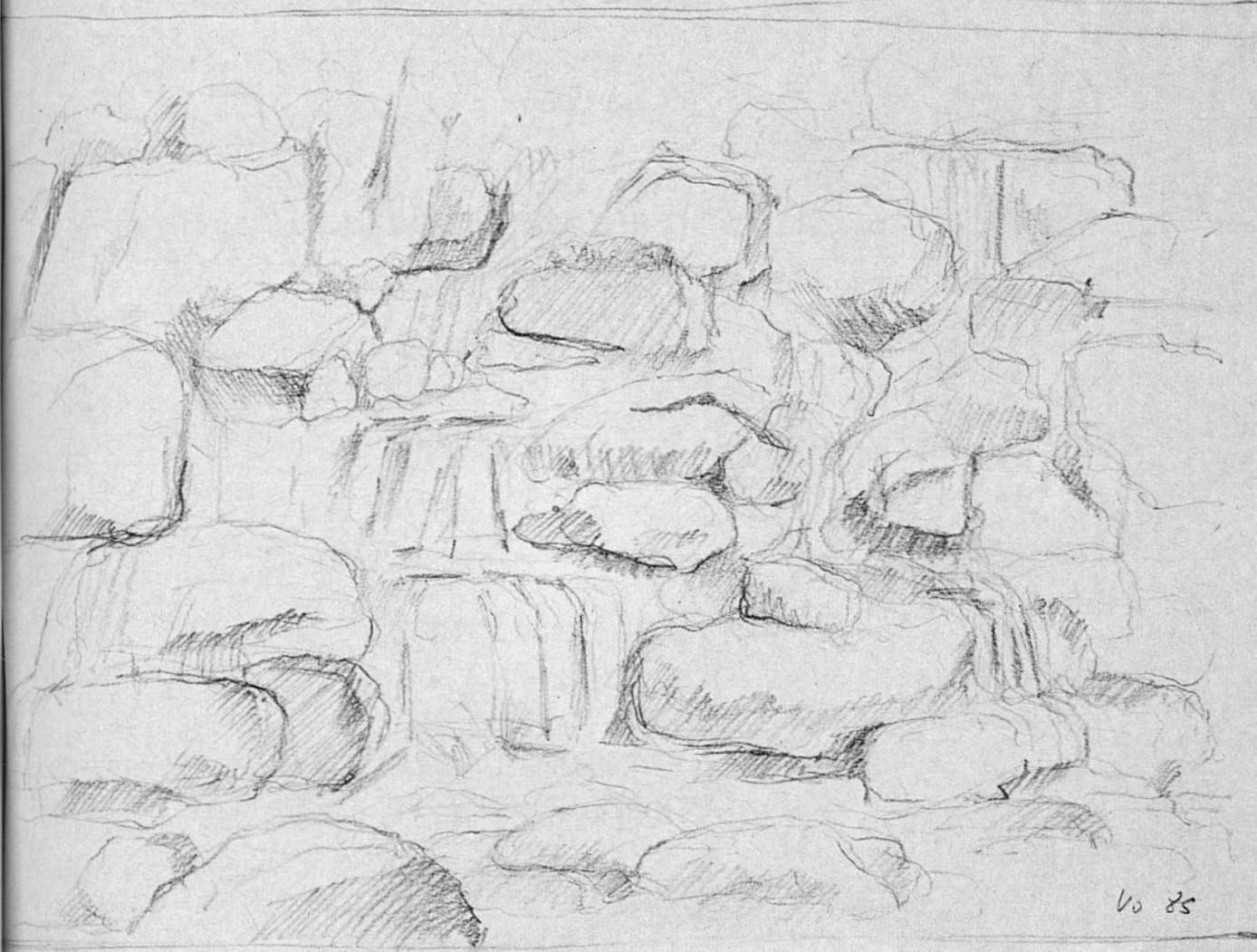
Dessegni da Gian Vonzun