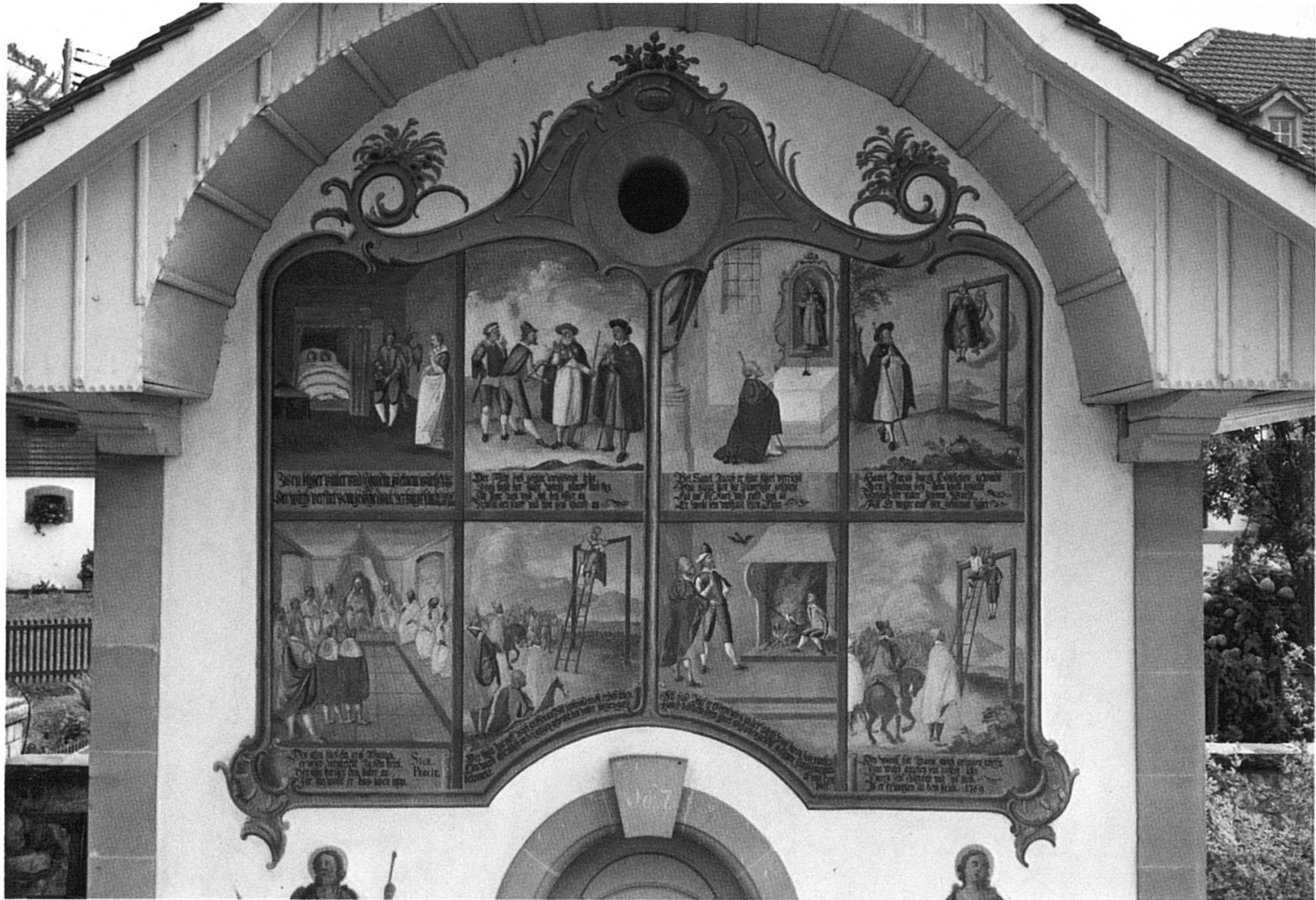
Fresco vid la fatschada dalla caplutta da Tifers/Friburg cun la legenda da s. Giachen en maletgs e text tudestg