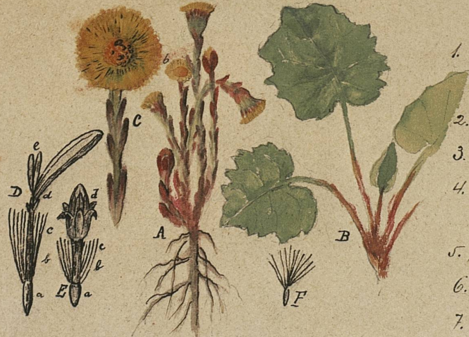
A. Die blühende Pflanze B. Blätter C. Oberer Teil des Schaftes mit dem Blütenköbchen in natürl. Gr; a Röhren- b. Bandblüten, D. Band-, E. Röhrenblüte, vergrößert a. Fruchtknoten b. Federkrone c. Röhre der Blumenkrone E. d. Staubbeutelröhre D. Griffeläste F. Frucht mit der Federkrone - Bis zum Koch.