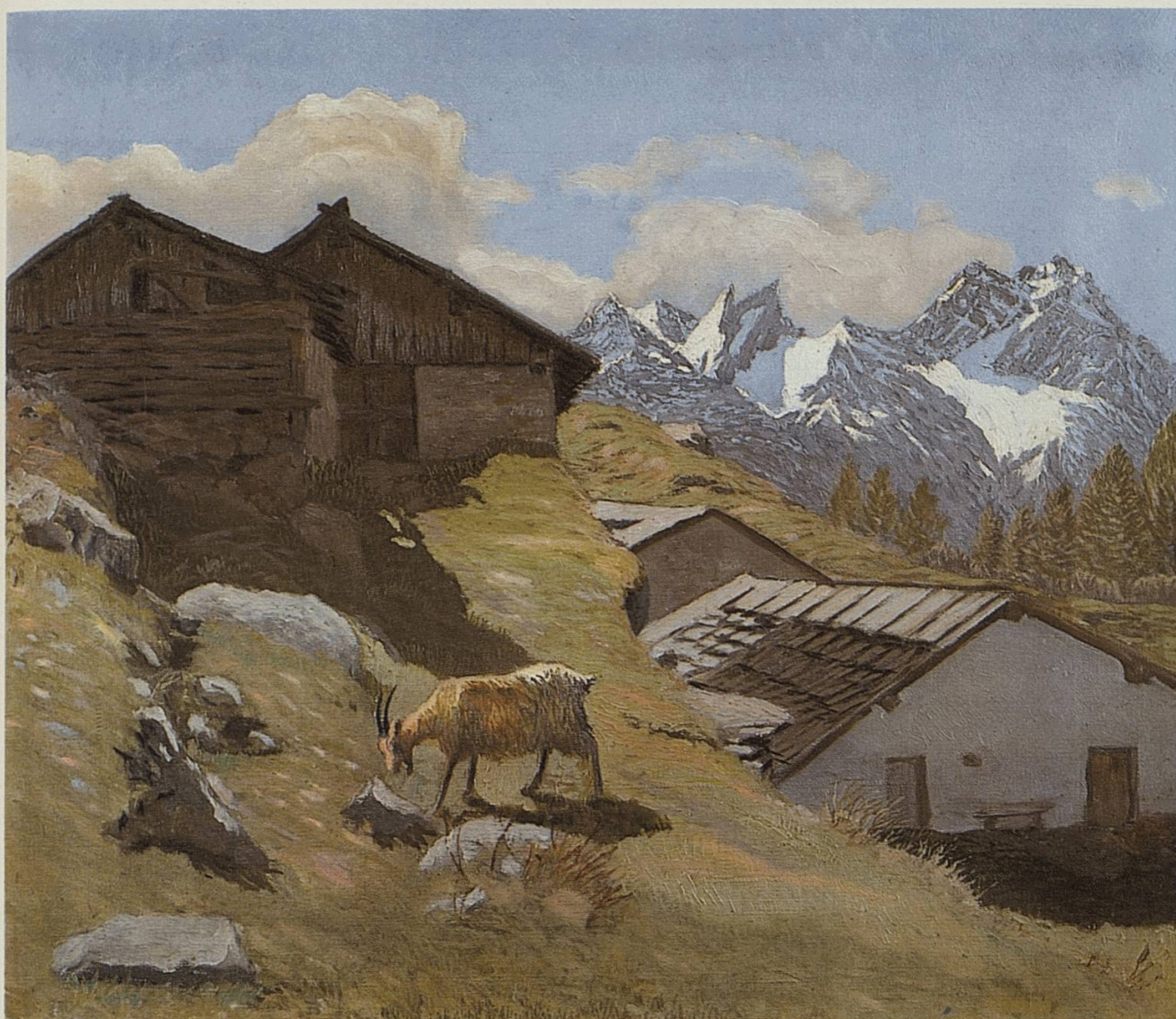
Süls Munts d'Ardez (purtret in öli)

Paginas 140, 143 e 144: skizzas in rispli per ün purtret in öli