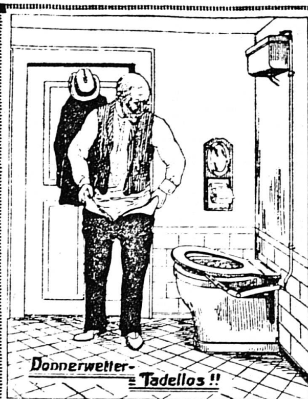
Donnerwetter — Tadellos !!