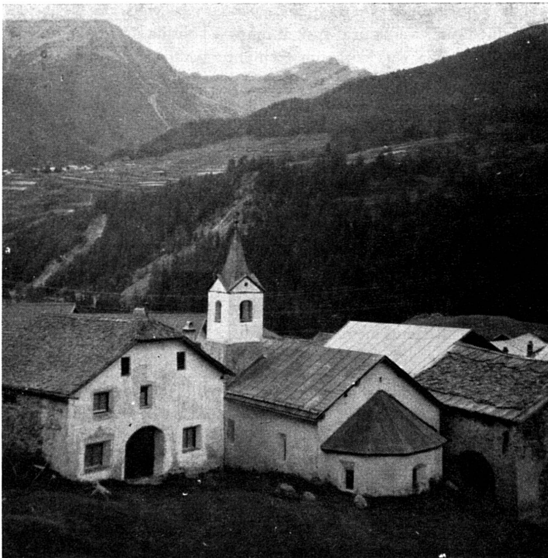
2. Baselgia da Sur En

Erwin Poeschel, il grond e baincuntschaint perscrutadur d'istorgia d'art, descriva la baselgia da Sur En in sias ouvras 11 ed eu prouv uossa da laschar seguir seis text in libra traducziun: