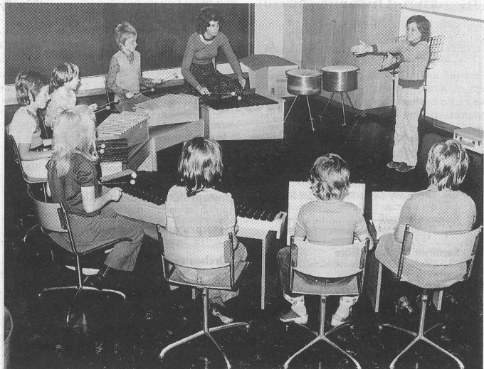
Gemeinsames Musizieren im Stammfach-Unterricht vermittelt positive Gruppenergebnisse und fördert so ein konstruktives gemeinsames Handeln.

Gemischte Ensembles führen zum Orchester. Die Schüler müssen bereits ziemlich selbstständig sein, vor allem was das Stimmen der Instrumente, das Notenlesen und das Meistern technischer Schwierigkeiten betrifft. Der Leiter oder die Leiterin muss die Noten der Stück-