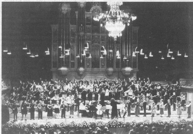
Grosses «Fiddlefest» mit 80 geigenden Kindern aus Harlem und Zürich und einigen Starsolisten in der Zürcher Tonhalle.

fen, gleichzeitig mit der Film Premiere eine Reprise des New Yorker Konzertes unter Mitwirkung von Zürcher Musikschülern in der Tonhalle zu veranstalten. Wiederum mit von der Partie waren Isaac Stern und Arnold Steinhardt. Nebst weiterer internationaler Podiums Prominenz konnten diesmal für die Mitwirkung in Bachs Doppelkonzert u.a. auch die Konzertmeister des Tonhalleorchesters, des Orchesters der Oper Zürich und des Winterthurer Stadtorchesters gewonnen werden.