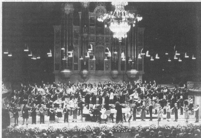
Grosses «Fiddlefest» mit 80 geigenden Kindern aus Harlem und Zürich und einigen Starsolisten in der Zürcher Tonhalle.