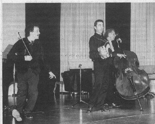
Ob Madrigal, Chanson oder Jazz: das Trio AVODAH begeistert mit seiner sprühenden Musikalität. Madrigale, chanson ou jazz, le Trio AVODAH impressionne par sa musicalité.