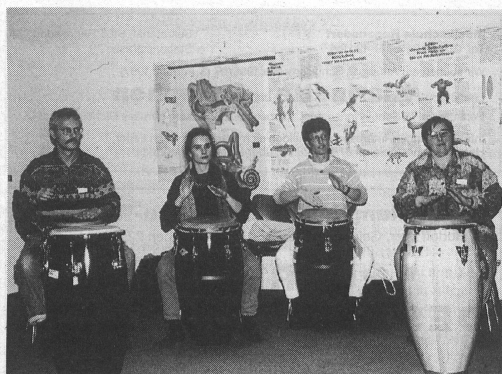
Neues Rhythmusleben mit afrikanischer und südamerikanischer Perkussionsmusik. Nouvelles expériences rythmiques avec les percussions africaines et sud-américaines.