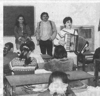
Für die Gäste ein frisches Lied.

Ein Kulturprojekt mit Musikern aus Tirana in St. Gallen mit Werken zeitgenössischer albanischer Komponisten und ein Treffen mit musikpädagogischem Gedankenaustausch ist im Frühjahr 1997 geplant. All die Projekte stehen und