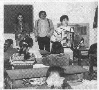
Für die Gäste ein frisches Lied.

Ein Kulturprojekt mit Musikern aus Tirana in St. Gallen mit Werken zeitgenössischer albanischer Komponisten und ein Treffen mit musikpädagogischem Gedankenaustausch ist im Frühjahr 1997 geplant. All die Projekte stehen und