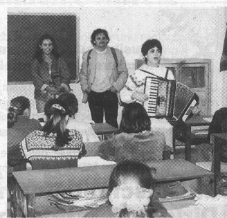
Für die Gäste ein frisches Lied.

Ein Kulturprojekt mit Musikern aus Tirana in St. Gallen mit Werken zeitgenössischer albanischer Komponisten und ein Treffen mit musikpädagogischem Gedankenaustausch ist im Frühjahr 1997 geplant. All die Projekte stehen und