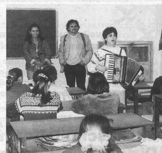
Für die Gäste ein frisches Lied.

Ein Kulturprojekt mit Musikern aus Tirana in St. Gallen mit Werken zeitgenössischer albanischer Komponisten und ein Treffen mit musikpädagogischem Gedankenaustausch ist im Frühjahr 1997 geplant. All die Projekte stehen und